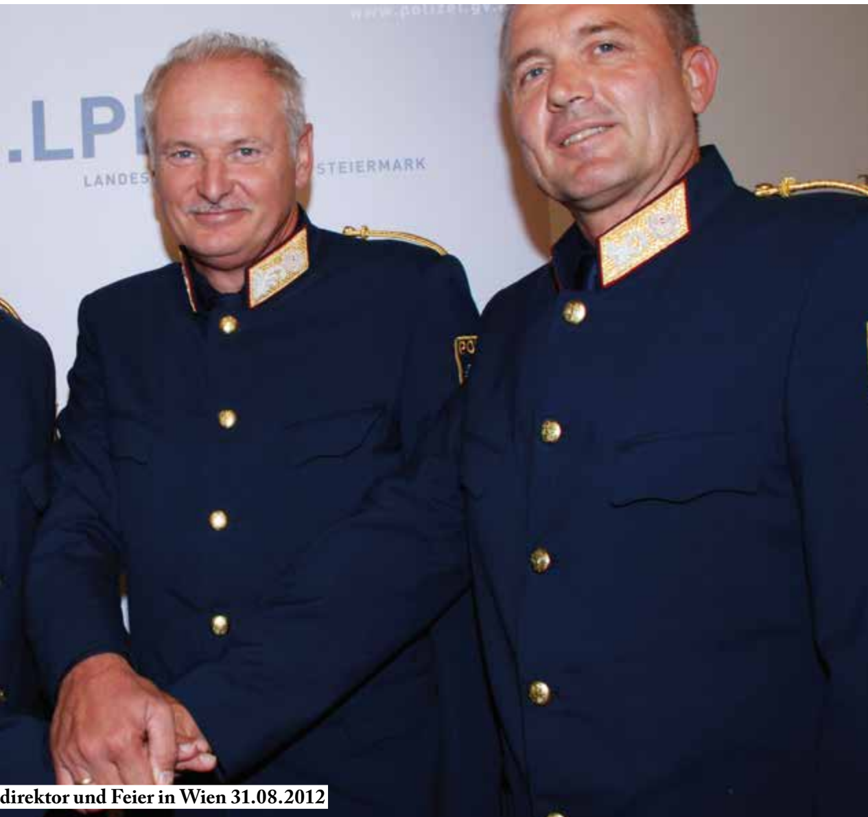
direktor und Feier in Wien 31.08.2012

Menschlichkeit zitierte er einen Satz aus der Mittelschulzeit: „Ohne Unruhe als kleinster Teil funktioniert auch der Zeiger einer Uhr nicht. Menschen haben den gleichen Wert und das war für mich immer wichtig. Beruflich und familiär.“