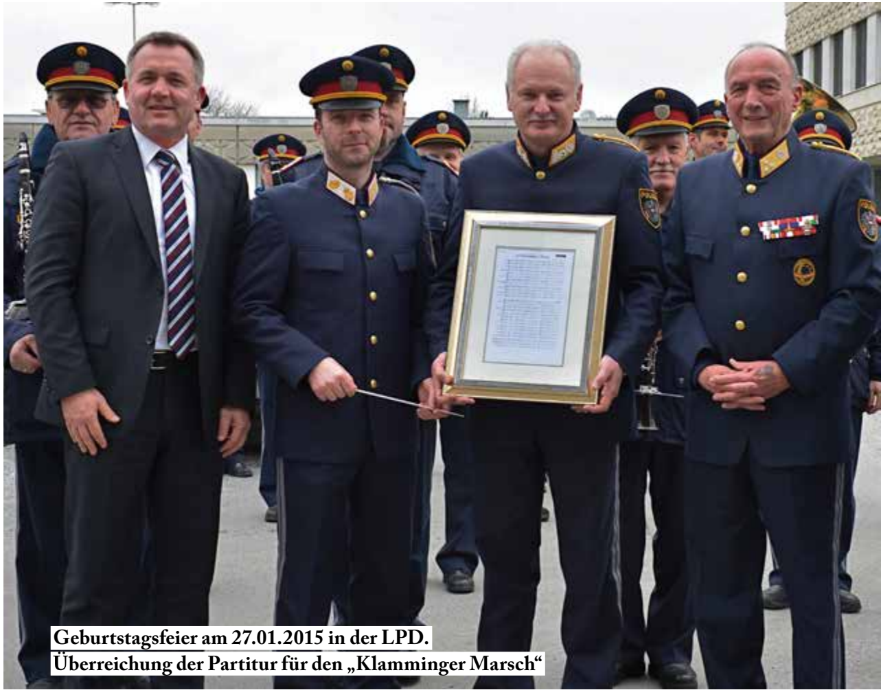
Geburtstagsfeier am 27.01.2015 in der LPD. Überreichung der Partitur für den „Klamminger Marsch“