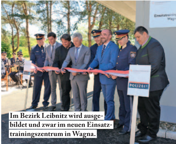
Im Bezirk Leibnitz wird ausgebildet und zwar im neuen Einsatztrainingszentrum in Wagner.