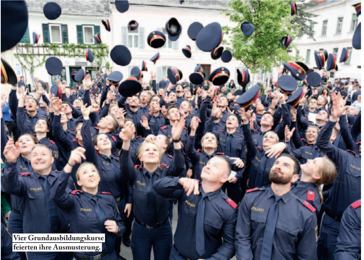
Vier Grundausbildungskurse feierten ihre Ausmusterung.

Im zweiten Quartal des heurigen Jahres gab es allen Grund sich zu freuen. 100 Damen und Herren feierten den Abschluss ihrer polizeilichen Grundausbildung, 72 Kolleginnen und Kolleginnen wurden zu dienstführenden Beamtinnen und Beamten ernannt.