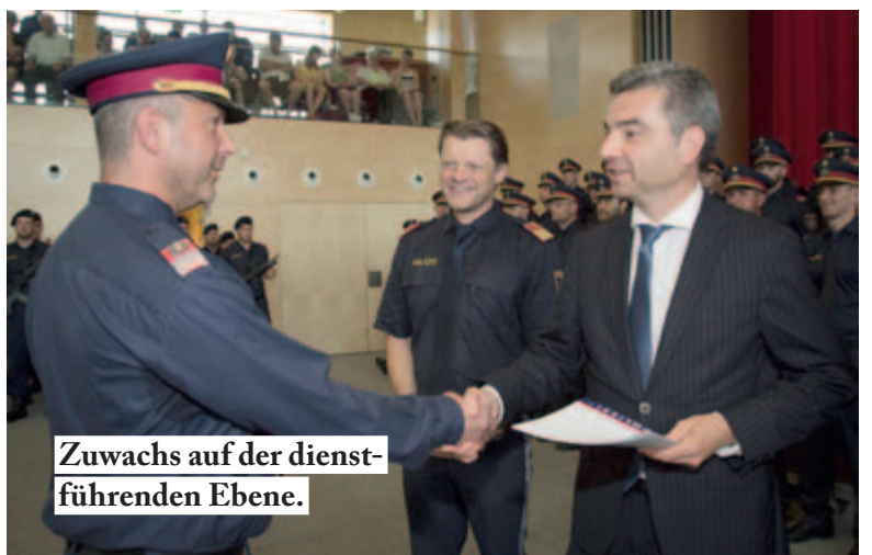
Zuwachs auf der dienstführenden Ebene.

Willkommen in der Polizeifamilie hieß es am 27. April 2019 für 100 Damen und Herren. Sie schlossen die polizeiliche Grundausbildung erfolgreich ab und freuten sich, ihre Ausmusterung am Hauptplatz in Stainz feiern zu dürfen. Landespolizeidirektor Gerald Ortner beglückwünschte die neuen Kolleginnen und Kollegen herzlich: „Absolventen: „Man darf als Polizistin und als Polizist nie