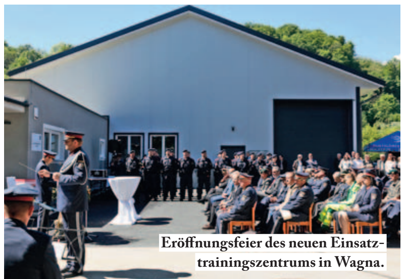
Eröffnungsfeier des neuen Einsatztrainingszentrums in Wagna.

Der Landespolizeidirektor ging in seiner Rede ebenfalls auf die Notwendigkeit einer zeitgemäßen Ausbildung ein. Das Einsatztrainingszentrum Wagna sei eines der modernsten Zentren in Österreich und biete für die steirische Polizei die Möglichkeit, mehr Kolleginnen und Kollegen, in kürzerer Zeit, noch professioneller auszubilden. Dieser Umstand solle für mehr Sicherheit für die Polizistinnen und Polizisten, aber gleichzeitig auch für die Bevölkerung, so der Landespolizeidirektor.