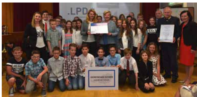
1. Klasse Volks- schule Leoben Seegraben