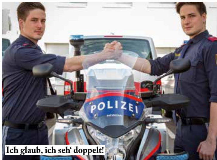
Ich glaub, ich seh' doppelt!