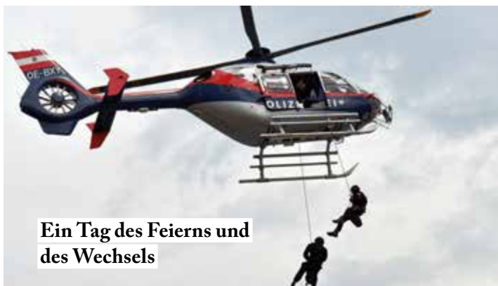
Ein Tag des Feierns und des Wechsels