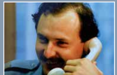
Als Polizeibeamter immer auf „Draht“