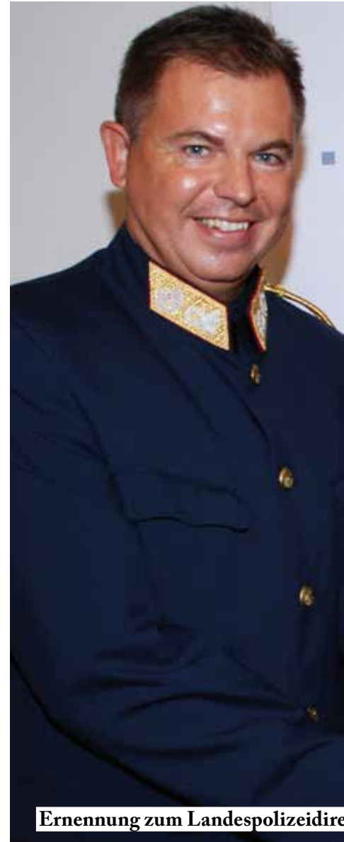
Ernennung zum Landespolizeidirektor

Bereits einen Tag nach seiner Ernennung zum Sicherheitsdirektor musste er seine Fähigkeit als Krisenmanager unter Beweis stellen. Bei einem Sprengstoffanschlag in der