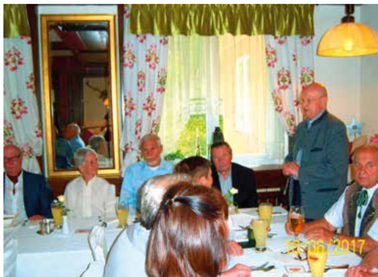
Fröhliches Beisammensein im Peterhof in Gratkorn