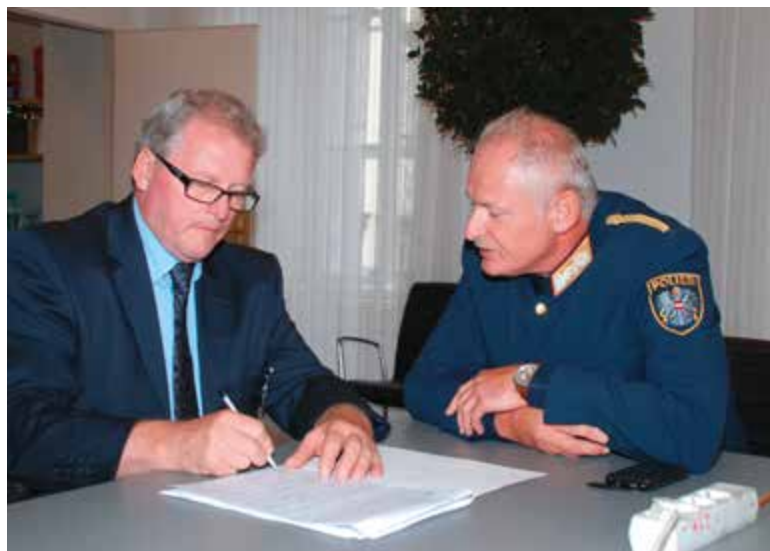
Erstes Interview nach der Ernennung zum Landespolizeidirektor mit Hans Breitegger

Die folgenden Jahre waren von zahlreichen Herausforderungen und Ereignissen geprägt. Die Wiedereröffnung der Synagoge und der Besuch des Dalai Lama in Graz, Aufdeckung der „Baumafia“ und eines groß-