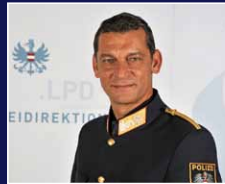
Landespolizeidirektor Mag. Helmut Tomac

In Osttirol und im Wipptal ist es gelungen polizeiliche Modellregionen zu schaffen und in Innsbruck die Basis für eine neue Polizeiinspektion (PI) am Bahnhof zu legen. Mit 1. Dezember 2014 haben die ehemaligen PI Matrei, Steinach und Gries am Brenner in einer neuen Unterkunft der ebenso neu geschaffenen PI Steinach-Wipptal den Betrieb aufgenommen. Damit wurde in zehn von elf Fällen die Fusion mit benachbarten Inspektionen zu