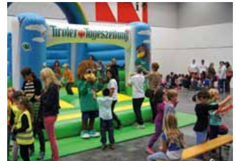
„Toni“ begrüßte die Kinder bei der Hupfburg der Tiroler Tageszeitung

erfuhren sie bei zahlreichen Präsentationsständen in der Messehalle auf spielerische und lustige Art und Weise Interessantes zum Thema Sicherheit. Mit der Verlosung wertvoller Klassenpreise der Kooperationspartner ging das KSÖ Kinderpolizeifest in der dankenswerter Weise von der Messe Innsbruck zur Verfügung gestellten Messehalle zu Ende.