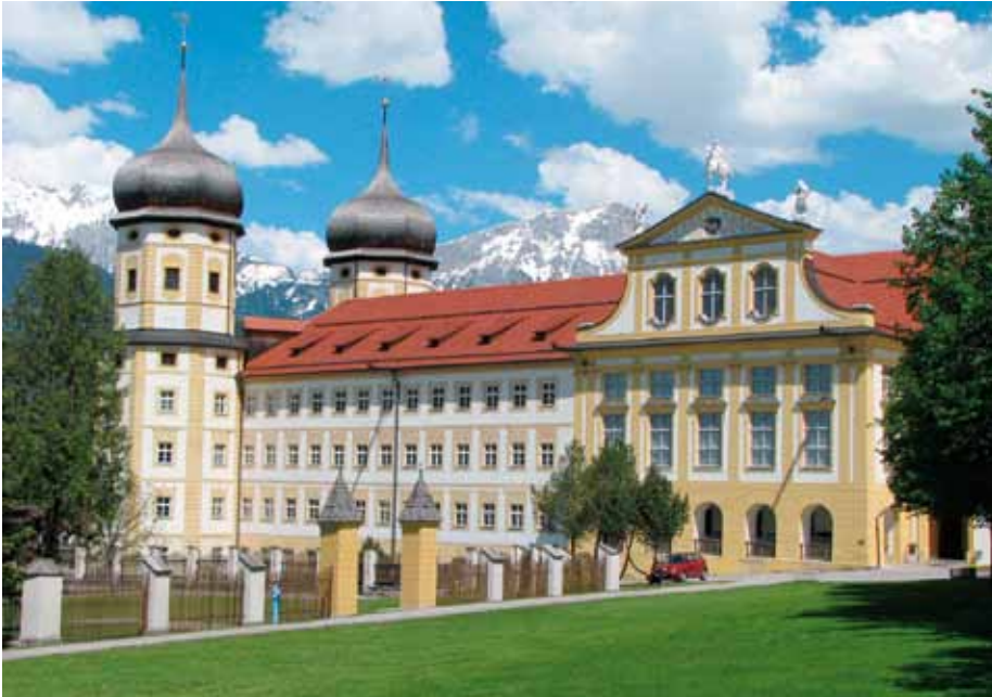
Stift Stams Außenansicht

quentiert. Darunter befindet sich auch eine hohe Anzahl von Schwerverkehrsfahrzeugen. Eine ganzjährig intensive Verkehrsüberwachung nach den Bestimmungen des Verkehrsrechtes in Verbindung mit allen kriminal- und sicherheitspolizeilichen Angelegenheiten ist unerlässlich.