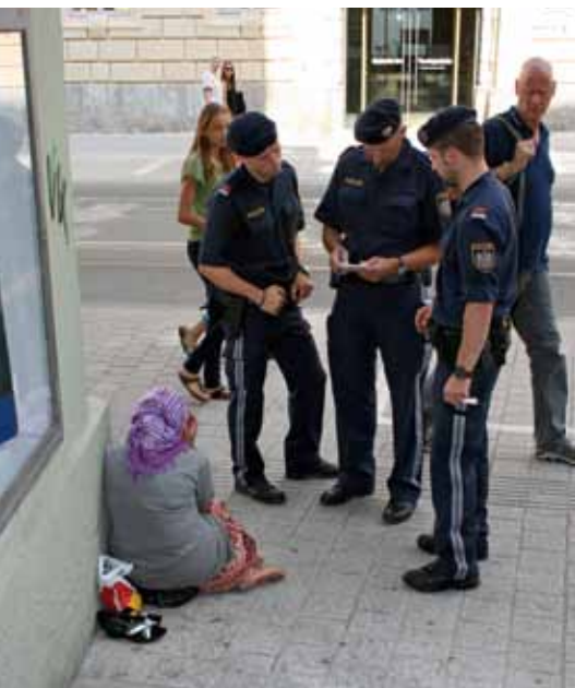
Bei der Streife in Innsbruck wurde das Hauptaugenmerk auf das Bettelwesen gelegt

Die Polizeiarbeit in Innsbruck mit den Themen „nordafrikanische Suchtgiftszene, illegale Prostitution und illegale Bettelerei“ war Inhalt des 6. Journalistentages der Tiroler Polizei am 25. Juli im Stadtpolizeikommando Innsbruck.