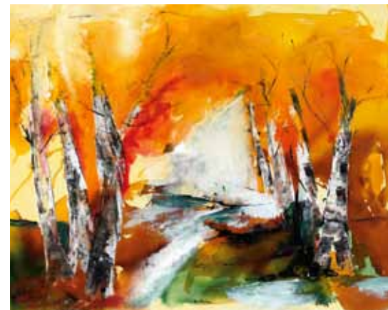
Birkenwald: Airbrushfarben und Spachteltechnik.