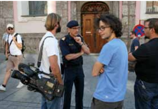
Obst Kirchler erläuterte den Medienvertretern den Ablauf der Kontrollen.

Die Polizeiarbeit in Innsbruck mit den Themen „nordafrikanische Suchtgiftszene, illegale Prostitution und illegale Bettelerei“ war Inhalt des 6. Journalistentages der Tiroler Polizei am 25. Juli im Stadtpolizeikommando Innsbruck.