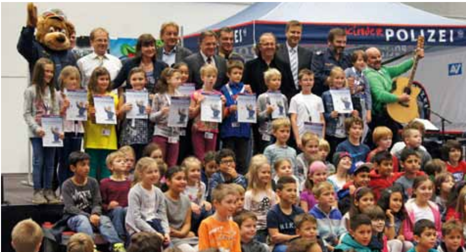
Große Begeisterung bei Groß und Klein bei der Präsentation des Kinderpolizeisongs „133 Kinderpolizei“

verkehr und im Freizeitbereich, richtiger Umgang mit Mitschülern, Respekt und Hilfestellung für ältere Personen sowie Beachtung und Weitergabe von Sicherheitstipps. „2014 widmet sich auch das KSÖ Tirol mit seinen Kooperationspartnern Land Tirol, Tiroler Tageszeitung, Raiffeisen Landesbank Tirol, AK Tirol, Tiroler Versicherung und Postbus GmbH in enger Zusammenarbeit mit dem Landesschulrat dem wichtigen Thema Kindersicherheitsprävention. Deshalb initiierte das KSÖ Tirol ein großes Kinderpolizeifest bzw. die Produktion der Kinderpolizei CD/DVD“, sagte