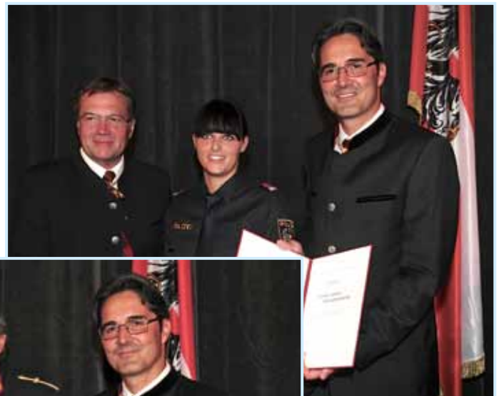
Die Landeshauptmänner von Nord- und Südtirol, Günther Platter und Arno Kompatscher, gratulierten zur Auszeichnung