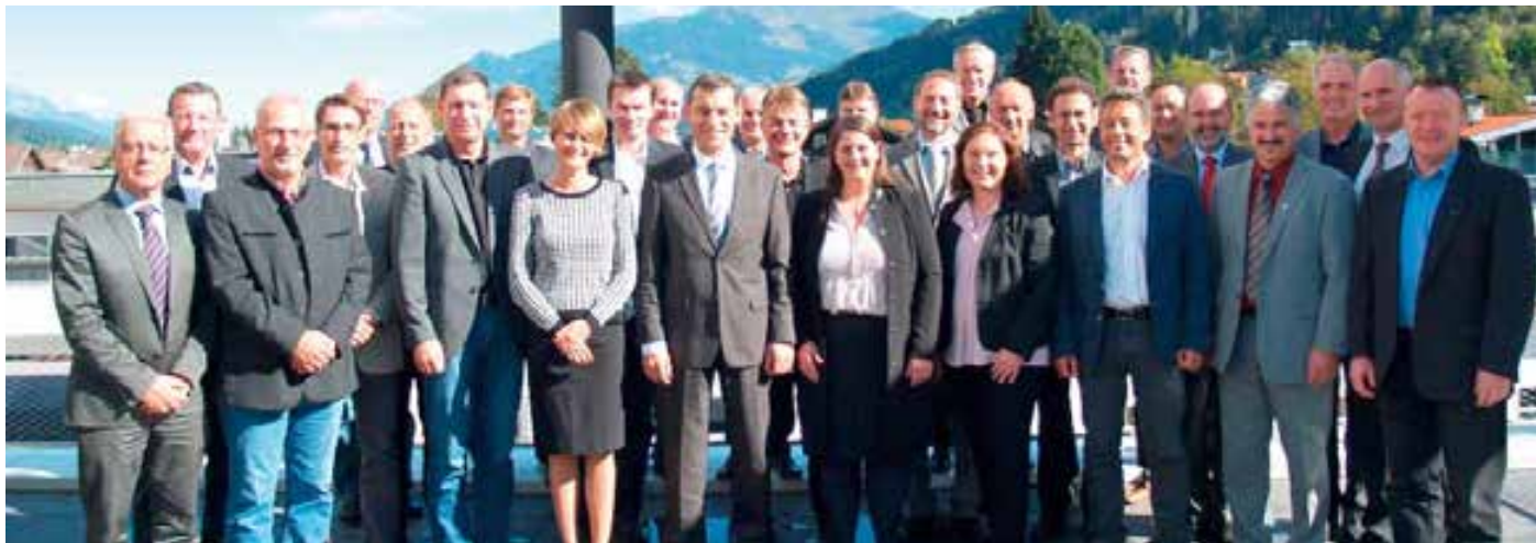
Tiroler Bezirkshauptleute mit der LPD-Geschäftsleitung, Stadt- und Bezirkspolizeikommandanten sowie Abteilungs- und Büroleiter der Landespolizeidirektion Tirol

Am 14. Oktober 2014 fand über Einladung der Firma SWARCO in der Konzernzentrale in Wattens eine Sicherheitsbehördliche Tagung der Tiroler Bezirkshauptleute mit der Geschäftsleitung und den zuständigen Abteilungs- und Büroleitern der Landespolizeidirektion statt.