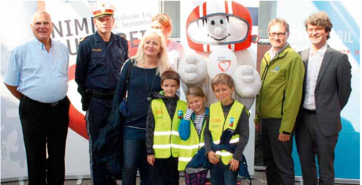
Schüler der Volksschule Absam Eichat mit den Projektpartnern Schule Mobil

Im Rahmen der Europäischen Mobilitätswoche waren die Kinder der Volksschule Absam Eichat unter dem Motto „Schule Mobil“ am 15. September 2014 zu einem Erlebnismorgens am Innsbrucker Hauptbahnhof eingeladen.