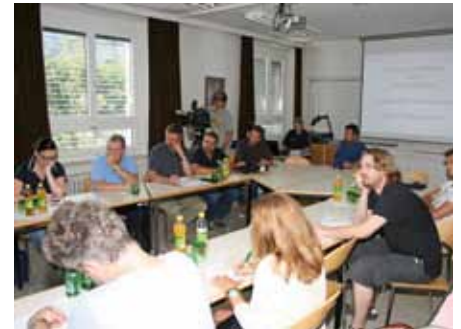
Die interessierten Journalistinnen und Journalisten beim theoretischen Teil

stitution und des illegalen Bettelnd. „Nach Möglichkeit nimmt an den Schwerpunktaktionen auch ein Behördenvertreter teil. Dadurch können Strafbescheide sofort zugestellt werden, wodurch eine Verfolgung wesentlich vereinfacht wird.“