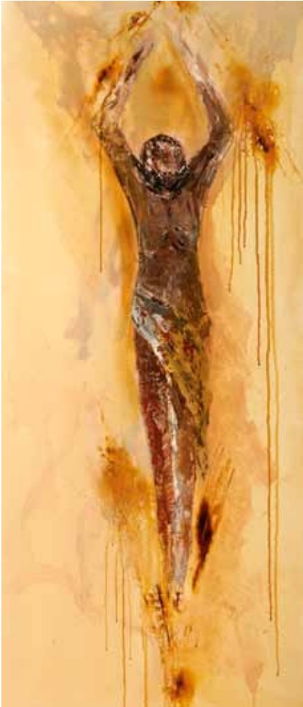
Herrgott mit Airbrushfarben und Sand.