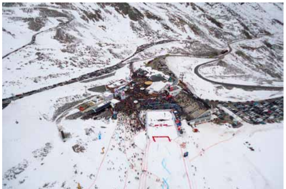
Weltcupauftakt Sölden während Siegerehrung

Tag und Nacht für die Sicherheit der Gäste sowie Bürgerinnen und Bürger. Die Hauptaufgabenbereiche der Dienststellen sind unterschiedlich aber durchwegs - verschiedener Ausprägung - beeinflusst durch und vom Tourismus. In der Inntalfurche (Zuständigkeit der Polizeiinspektionen Silz, Ötz und Imst) ist der „Kriminaltourismus“ immer stärker spürbar, die Fernpassroute (Zuständigkeit der Polizeiinspektionen Nassereith und Imst, Zulaufstrecke auch Silz) beschert den Beamten und Beamtinnen eine Dauerbeschäftigung in den verschiedensten Verkehrsbereichen.