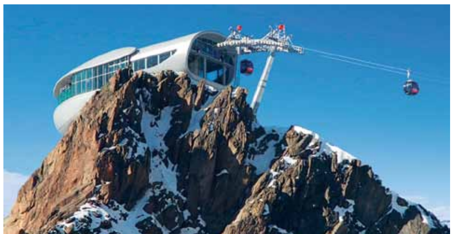
Cafe 3440 mit Wildspitzbahn am Pitztaler Gletscher

Die Hauptverkehrsrouten im Bereich Inn-, Ötz- und Gurgltal sowie Mieminger Plateau und Fernpass stellen hohe Anforderungen an die Verkehrsüberwachung. Die Hahntennjochstraße als Verbindung von Imst ins Außerfern ist bei den Motorradfahrern sehr beliebt. Der Urlauberschichtwechsel bringt während der Saisonzeiten im Gurgltal auf der Mieminger Straße B 189 massive Verkehrsstaus mit sich und bedeutet eine hohe Belastung für die Bevölkerung. Die Fernpassstrecke als Nadelöhr zwischen dem italienischen und deutschen Raum wird durchschnittlich täglich von ca. 5.000 – 10.000 Fahrzeugen, an Spitzentagen sogar von der doppelten Anzahl fre-