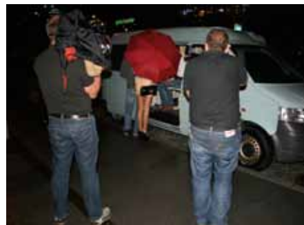
Die Journalisten konnten eine Streife zur Bekämpfung der illegalen Prostitution begleiten