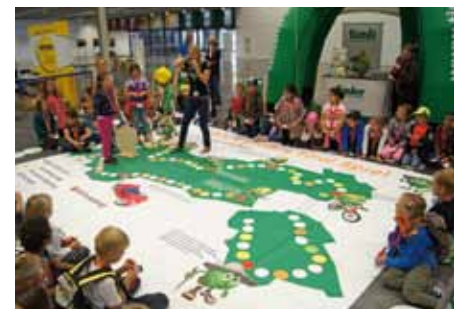
Würfelspiel am Stand der Tiroler Versicherung