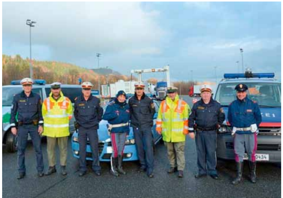
Verkehrspolizisten aus Tirol, Südtirol und Bayern gemeinsam bei der KOST Radfeld im Einsatz