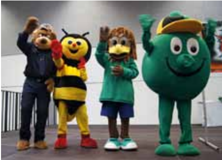
Maskottchen unter sich: Tommi, Sumsi, Toni und Tiroli

Kuratorium Sicheres Österreich Landesklub TIROL