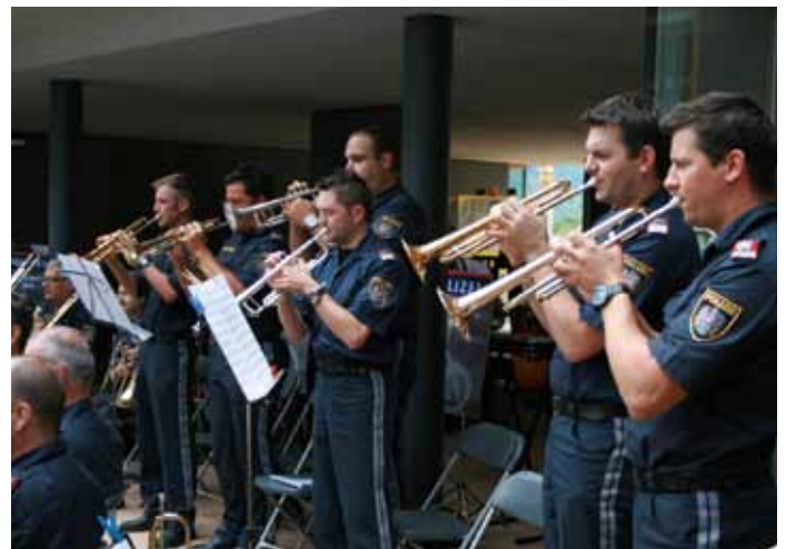
Das Trompetenregister in Aktion