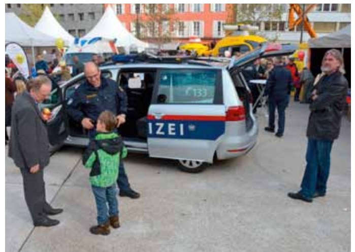
Auch beim Tag der offenen Tür am Landhausplatz war die Polizei vertreten