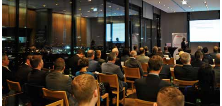
Zahlreiche interessierte ZuhörerInnen folgten im Tirol Panorama den Ausführungen der Diskutanten