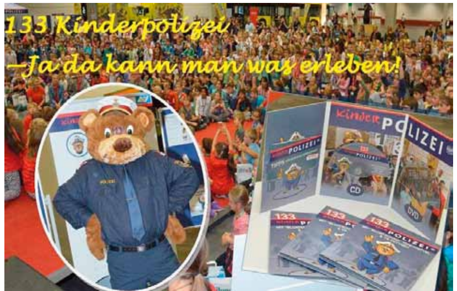
1000 Kinder besuchten das KSÖ-Kinderpolizeifest in der Messehalle in Innsbruck

polizei-CD/DVD; 133 Kinderpolizei. Seit 2006 wurden an Tiroler Volksschulen in enger Zusammenarbeit zwischen den Schulen und der Tiroler Polizei rund 35.000 „Kinderpolizistinnen und Kinderpolizisten“ ausgebildet – mit dem Ziel, Kinder schon in jungem Alter auf die Gefahren in Alltagssituationen aufmerksam zu machen. Zur Ausbildung gehören Verkehrserziehung, Kriminalprävention, Abbau von Vorurteilen und direkter Gesprächskontakt mit Kindern und Eltern. Organisiert wird