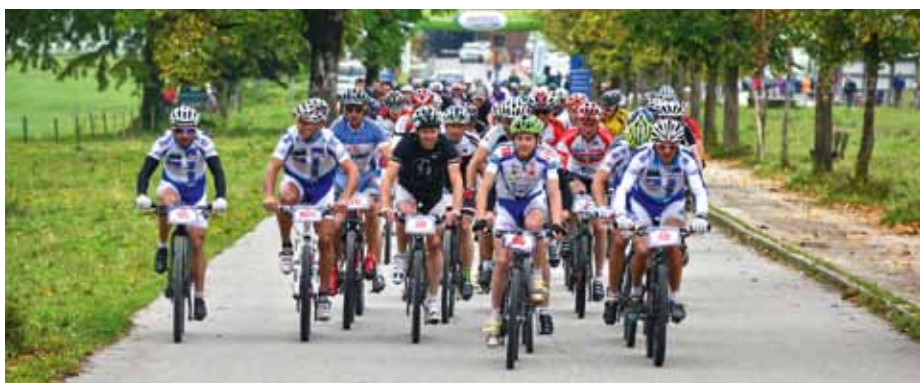
Kurz nach dem Start