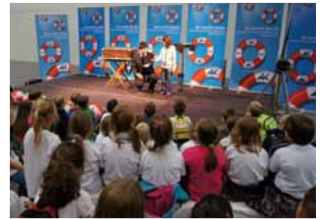
Ein Zauberer zog die Kinder am Stand der AK-Tirol in seinem Bann