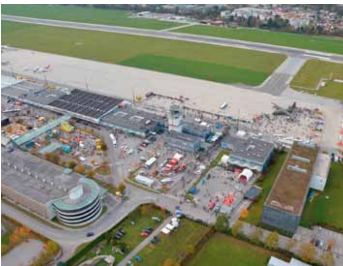
30000 Gäste besuchten das Flughafenfest 2014