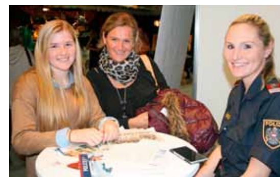
Immer mehr Frauen interessieren sich für den Polizeiberuf.

fragen wurden bei der BeSt 3 auf verschiedenen Ständen in Vorträgen bzw. in moderierten Diskussionsrunden erläutert. Großer Andrang herrschte am Polizeipräsentationsstand, der von Bediensteten der Personalabteilung und des Büro für Öffentlichkeitsarbeit der Landespolizeidirektion betreut wurde. Besonders interessierten sich die jungen