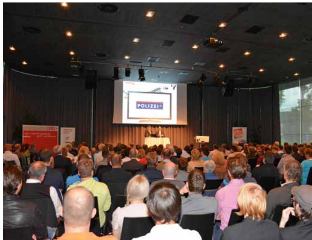
Über 300 interessierte Zuhörer besuchten die KSÖ-Tirol Veranstaltung in Igls