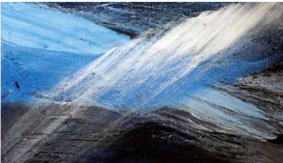
Sand mit Champagnekreide und Pigmenten

Im Sommer 2014 durfte ich einen nicht alltäglichen Kurs mit dem Künstler und Kursleiter „Carsten Westphal“, den Maler der Wüste, miterleben. Der Kurs fand im außergewöhnlichen Ambiente des Bildungshauses Kloster Neustift in Südtirol statt.