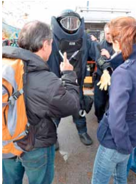
Ein beliebtes Fotomotiv, die SKO-Schutzausrüstung