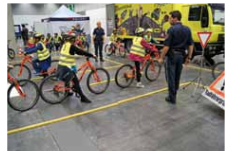
Mobile Jugendverkehrsschule am Stand der RLB Tirol