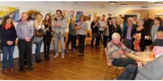
Zahlreiche Besucher bei der Vernissage im Sozialsprengel Telfs.