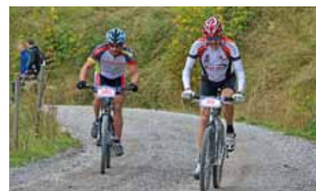
Positionskämpfe auf der Strecke