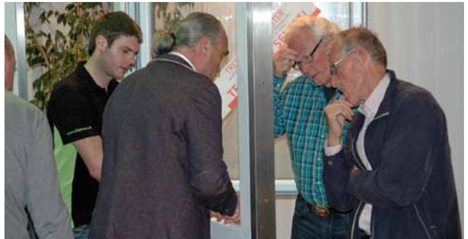
Die Besucher informierten sich unter anderem über ausgestellte Sicherheitsfenster