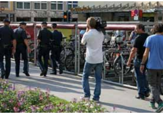
Die Polizeibeamten gingen gemeinsam mit den Journalisten in Innsbruck auf Streife.