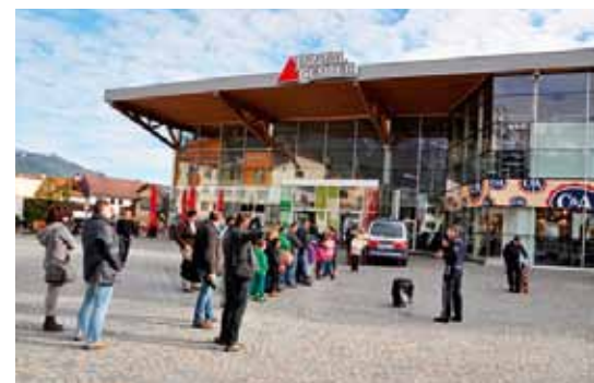
Die Polizeidiensthundeführer bei ihrer Vorführung.