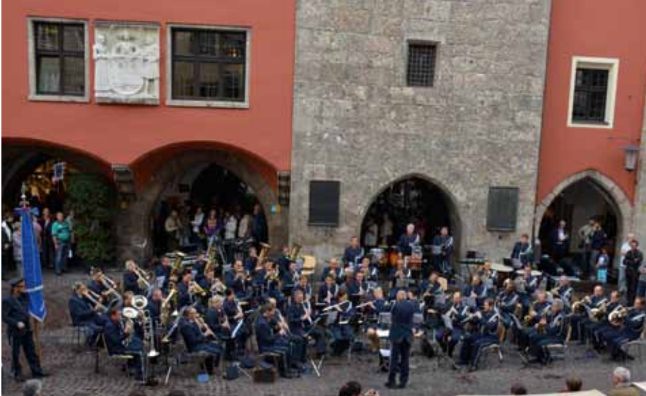
Altstadtkonzert der Polizeimusik Tirol in Innsbruck

Auch in der Konzertsaison 2014 machte die Polizeimusik Tirol wieder in allen Tiroler Bezirken Station. Die Polizistinnen und Polizisten der Polizeimusik, die perfekte Öffentlichkeitsarbeit für die Tiroler Polizei leisteten, präsentierten sich in hochwertiger musikalischer Qualität bei den Konzerten in Sillian, Ischgl, Imst, Innsbruck, Tux, Kitzbühel, Elbigental, Rinn und Bad Häring dem begeisterten Publikum.