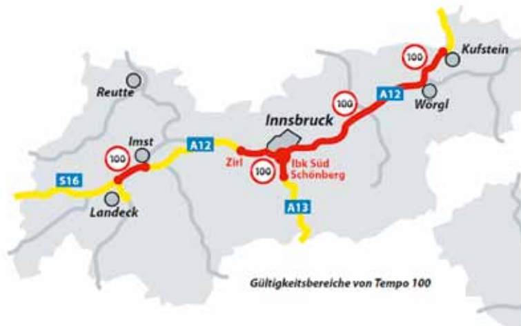
Gültigkeitsbereiche von Tempo 100