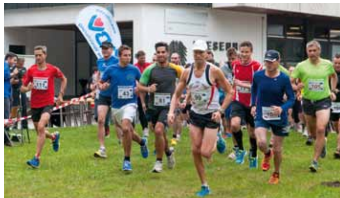
Start der 113 Läufer und Läuferinnen