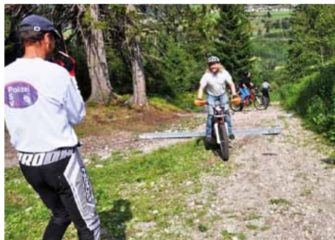
Unter fachkundiger Anleitung konnten die Teilnehmer ihr Können bei den Fahrsicherheitskursen verbessern