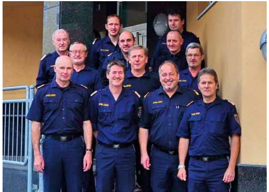
Inspektionskommandanten und Stellvertreter: