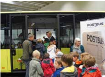
Interessierte Kinder am Stand der Postbus GmbH

1000 Kinder sangen am 10. Oktober mit „Bluatschink“ beim KSÖ Tirol Kinderpolizeifest in der Messe Innsbruck das Titellied der neuen Kinder-