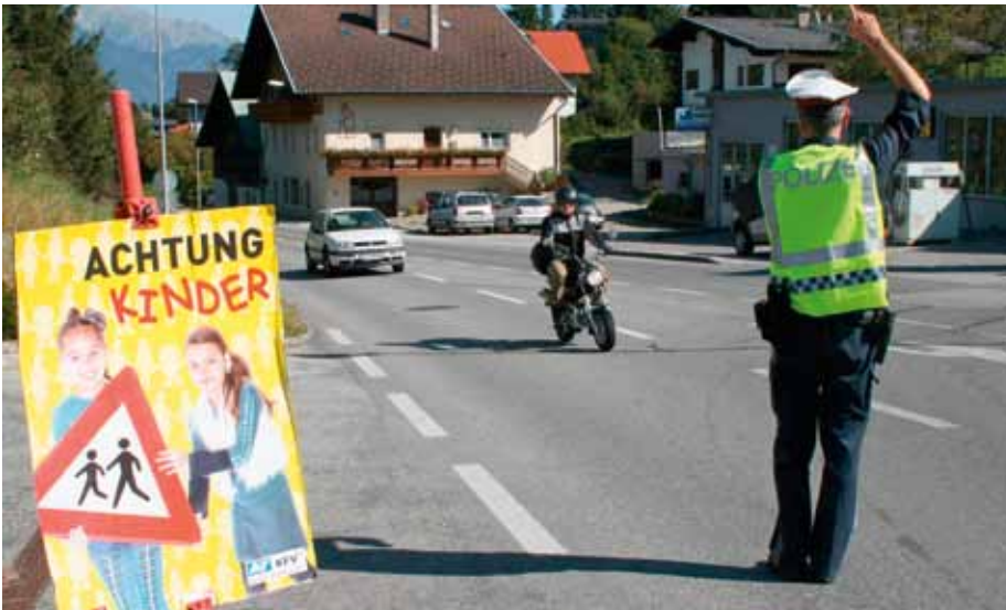
Bei Geschwindigkeitskontrollen in Aldrans wurden nicht nur Verkehrsübertretungen geahndet sondern auch vorbildliche Autofahrer „belohnt“