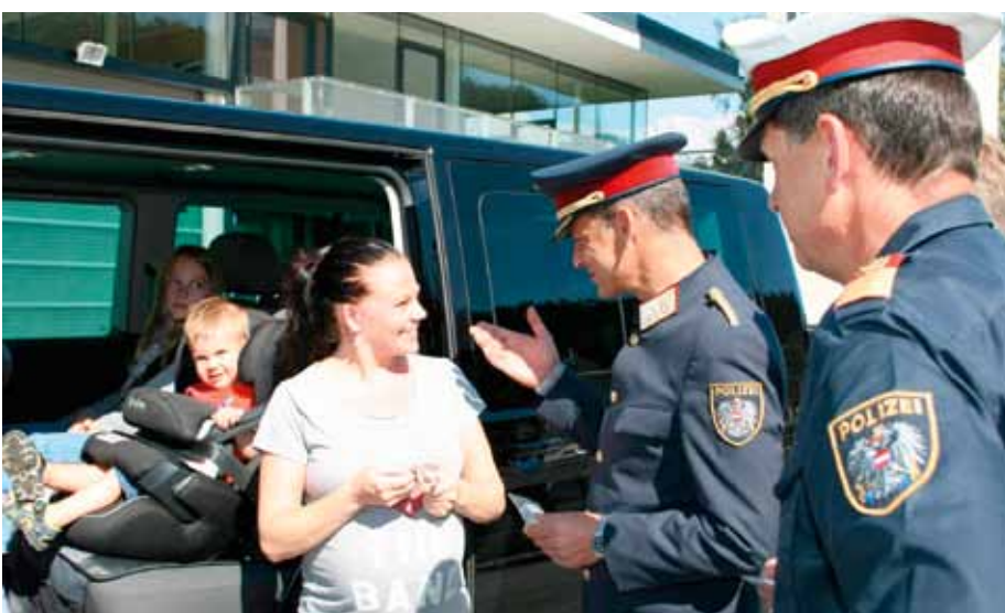
Mag. Tomac überreicht an eine Autofahrerin und ihre vorbildlich im Fahrzeug gesicherten Kinder Sicherheitsarmbänder

„Wir appellieren an alle Fahrzeuglenkerinnen und –lenker, sich der großen Verantwortung gegenüber Kindern im Straßenverkehr bewusst zu sein. Der Vertrauensgrundsatz findet hier keine Anwendung. Der Nahbereich von Schulen und Kindergärten erfordert eine besonders vorsichtige und rücksichtsvolle Fahrweise jedes Einzelnen. Die Geschwindigkeit muss unbedingt reduziert und den Kindern jederzeit ein gefahrloses Überqueren der Straße ermöglicht werden. Auf diese Weise können alle zu noch mehr Sicherheit auf Tirols Schulwegen beitragen“, sagte Obst Widmann.