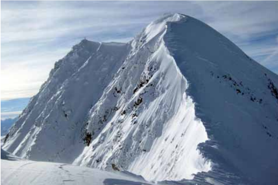
Wildspitze mit Nordostgrat (Jubiläumsglat)