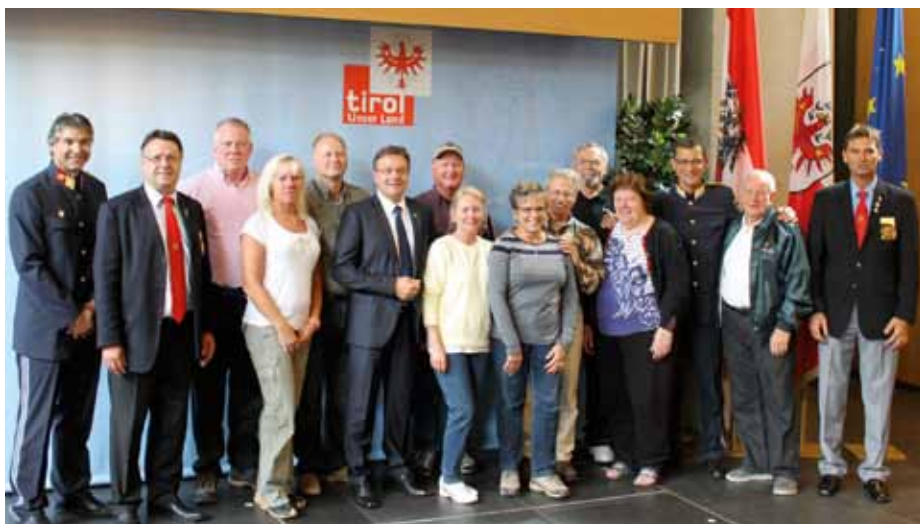
Besuch der IPA-Delegation mit LPD Mag. Helmut Tomac bei Landeshauptmann Günther Platter

besonderer Höhepunkt. Auch der Besuch auf der Bergisel Sprungschanze am Samstag mit dem anschließenden Mittagessen im Panorama Restaurant werden vielen Besuchern in guter Er-