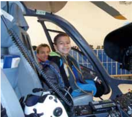
Ein kleiner Pilot.

Das KSÖ Tirol verlor beim großen Kinderpolizeifest in der Messe Innsbruck am 10. Oktober einen Blick hinter die Kulissen bei der Tiroler Polizei. Am 1. Dezember besuchten 32 Schülerinnen und Schüler mit zwei Lehrerinnen der Volksschule Pradl-Ost als Gewinner dieses Preises die Lan-