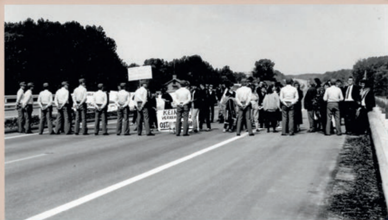
Demonstration anlässlich der Eröffnung des Teilstückes der A4 von Wien bis Fischamend im Juli 1986. Die Beamten der neu gegründeten Einsatzeinheit NÖ verrichteten noch Dienst ohne Sonderausrüstung.