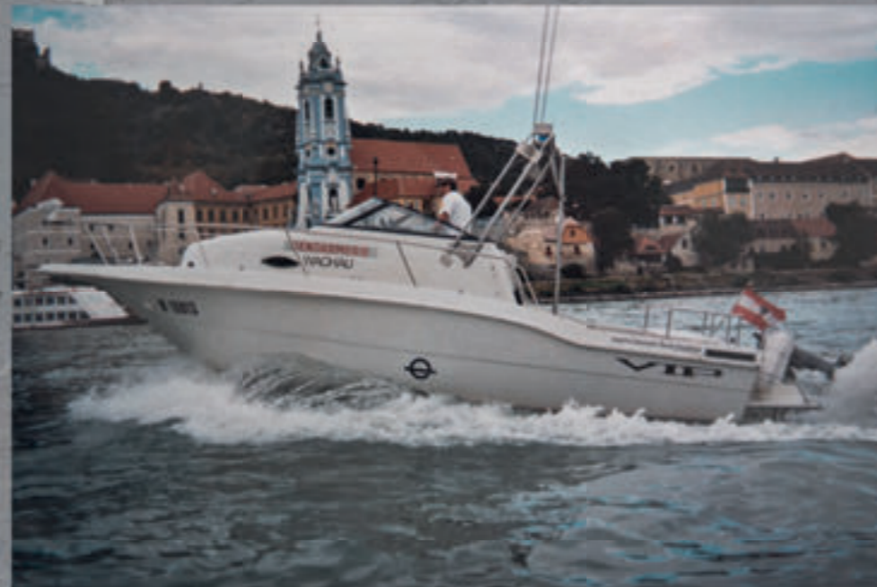
Gendarmerieboot „WACHAU“ vor Dürnstein im Jahre 2005