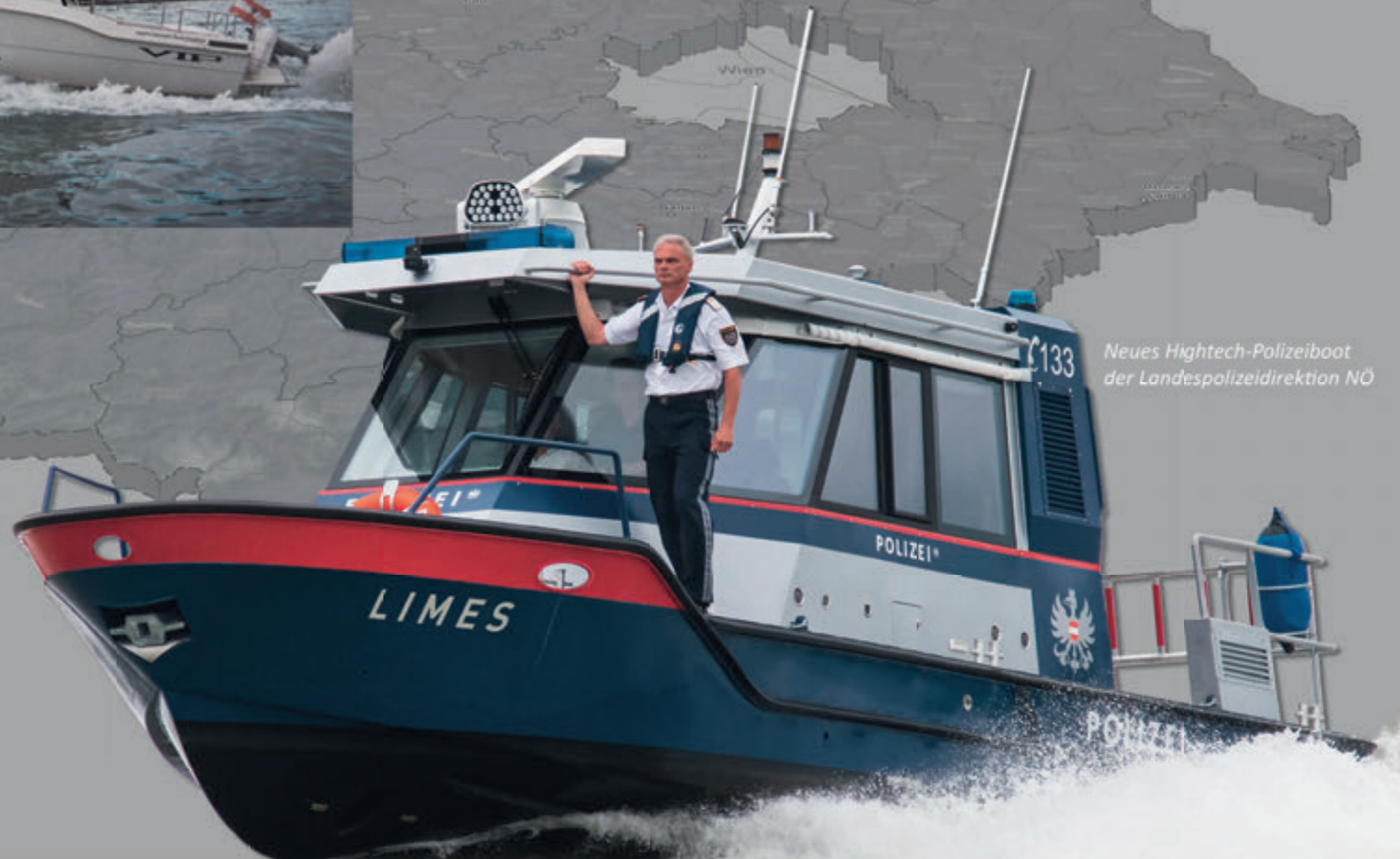
Neues Hightech-Polizeiboot der Landespolizeidirektion NÖ