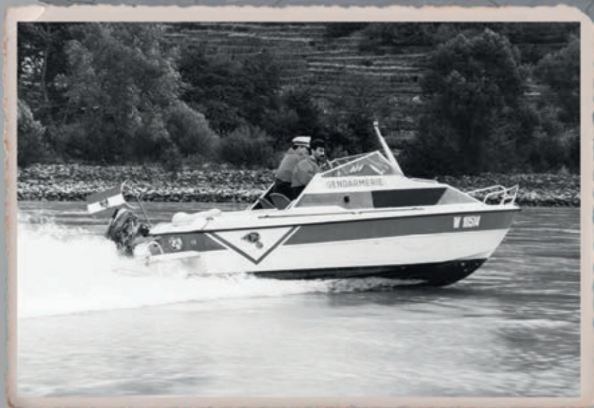
Gendarmerie-Stromdienst auf der Donau im Jahre 1994