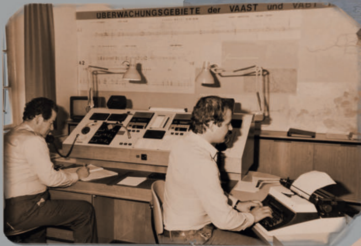
Einsatzzentrale der Verkehrsabteilung des damaligen Landesgendarmeriekommando für NÖ in der Meidlinger Kaserne in den 1980er-Jahren

Arbeitsplatz der Landesverkehrsabteilung in der Landesleitzentrale der Landespolizeidirektion NÖ