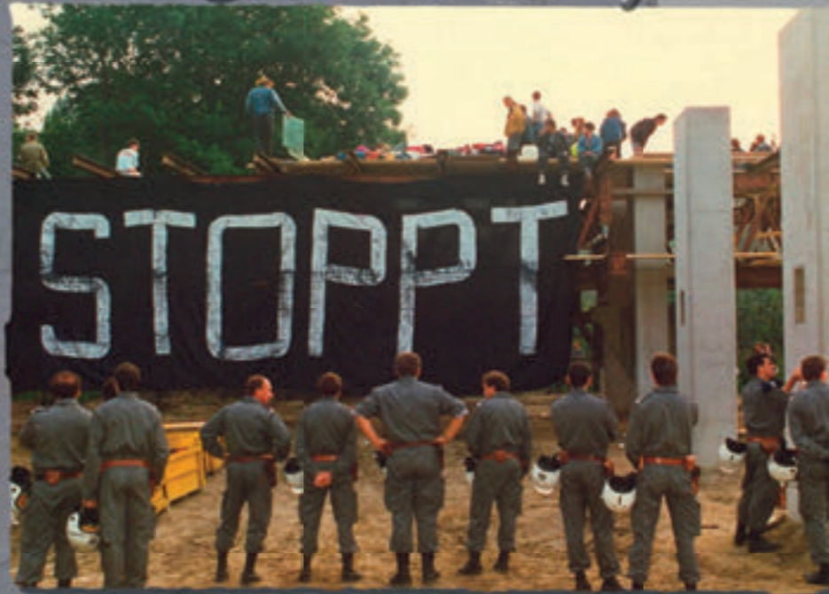
Demonstration gegen den Weiterbau der A4 im Jahre 1990