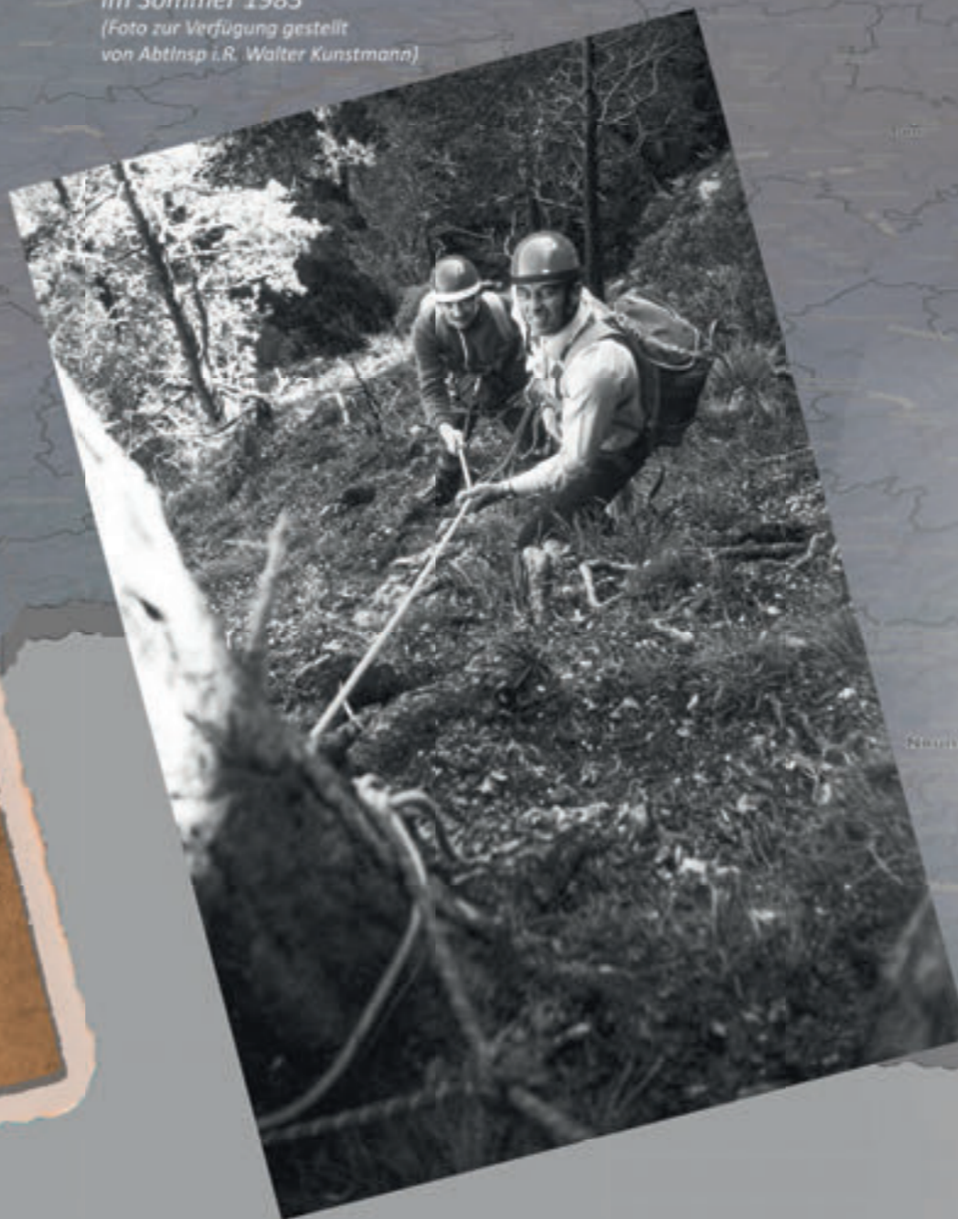
Alpineinsatz am Ötscher im Sommer 1983