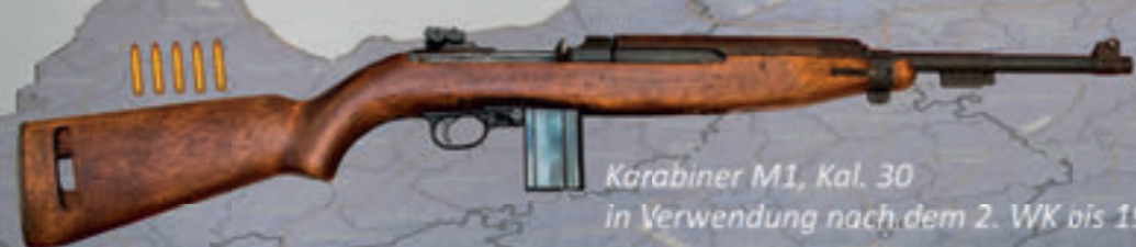
Karabiner M1, Kal. 30 in Verwendung nach dem 2. WK bis 1988