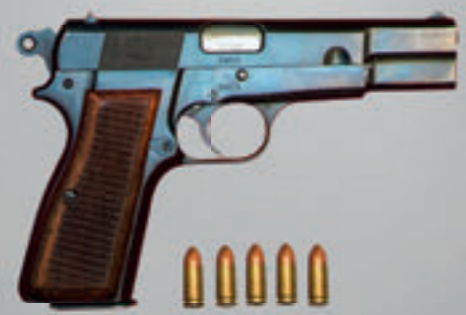
Pistole M35 FN Browning HP (Highpower) Kal. 9 x 19 mm, 13-schüssig in Verwendung von 1956 bis 1995