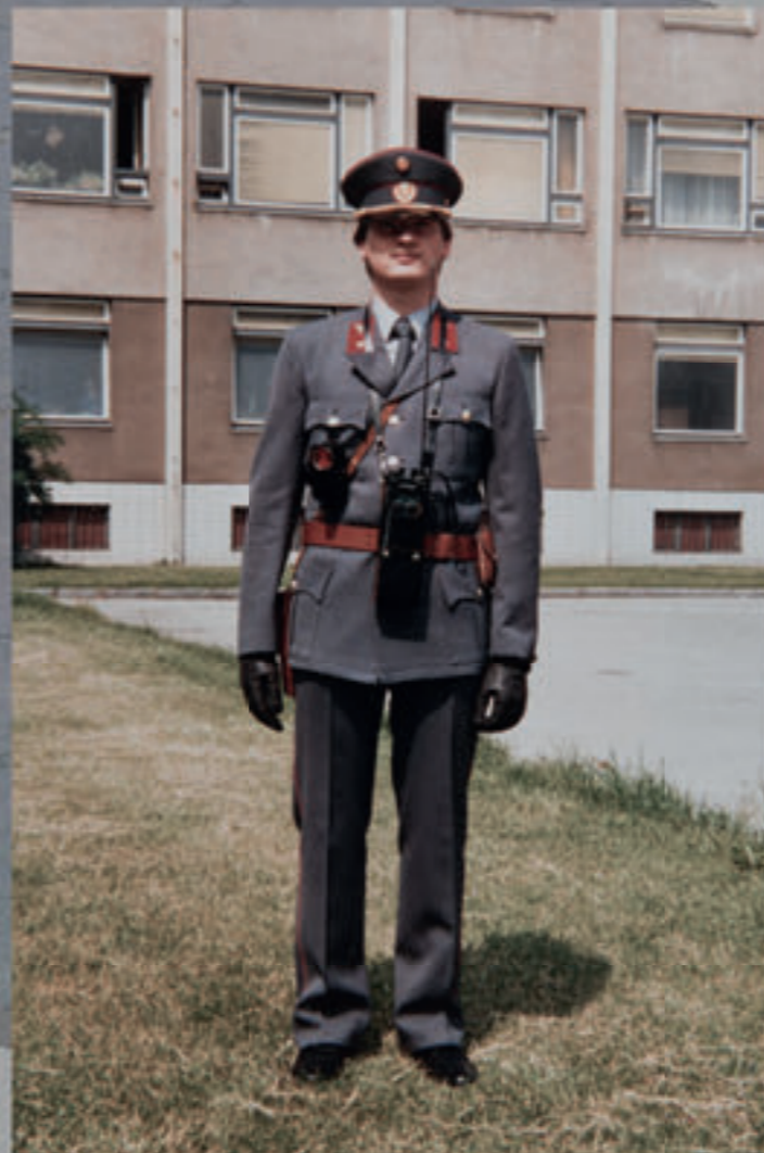
Gendarmerie-Adjustierung Ende der 1970er-Jahre