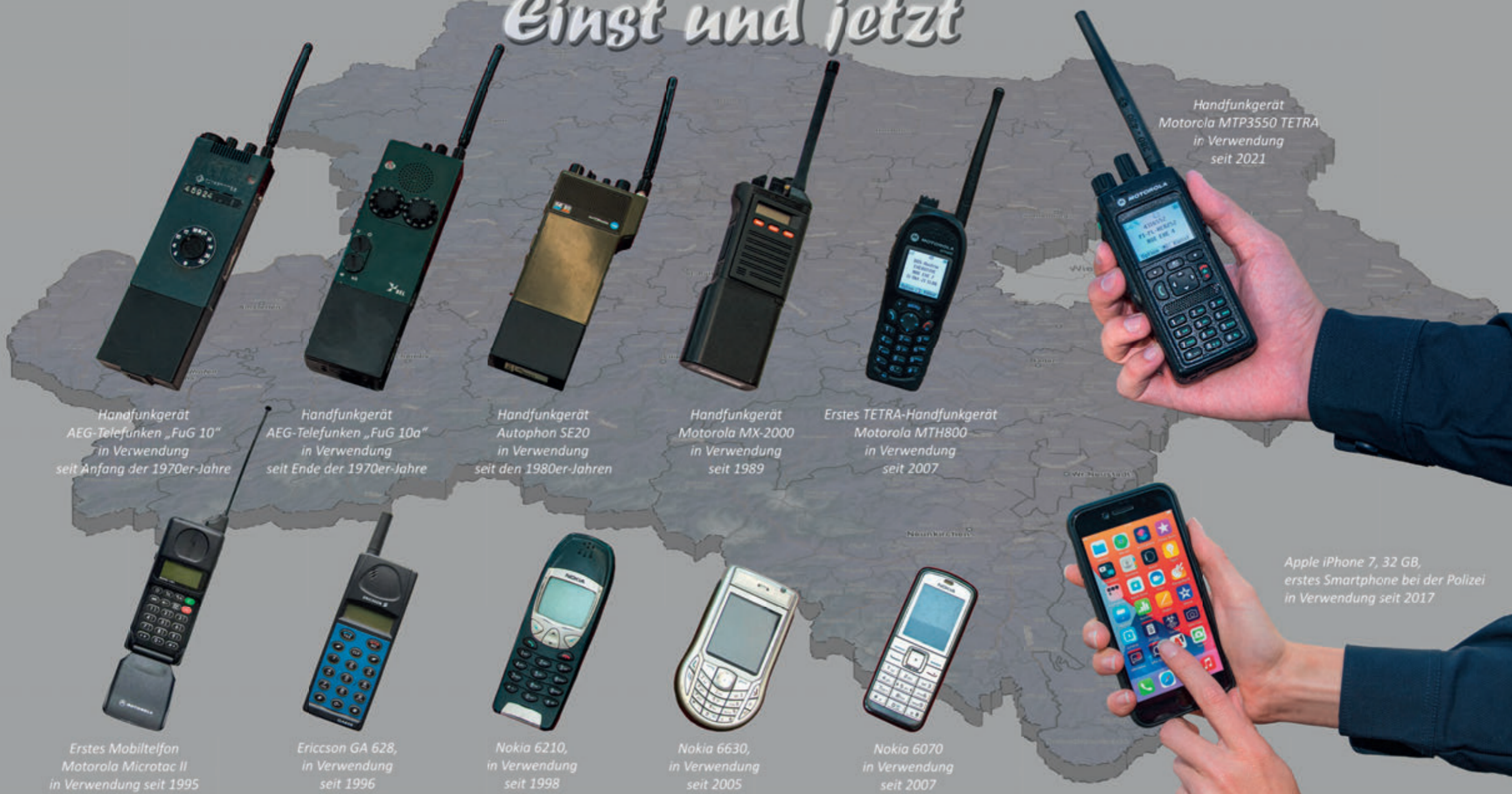
Handfunkgerät AEG-Telefunken „FuG 10“ in Verwendung seit Anfang der 1970er-Jahre