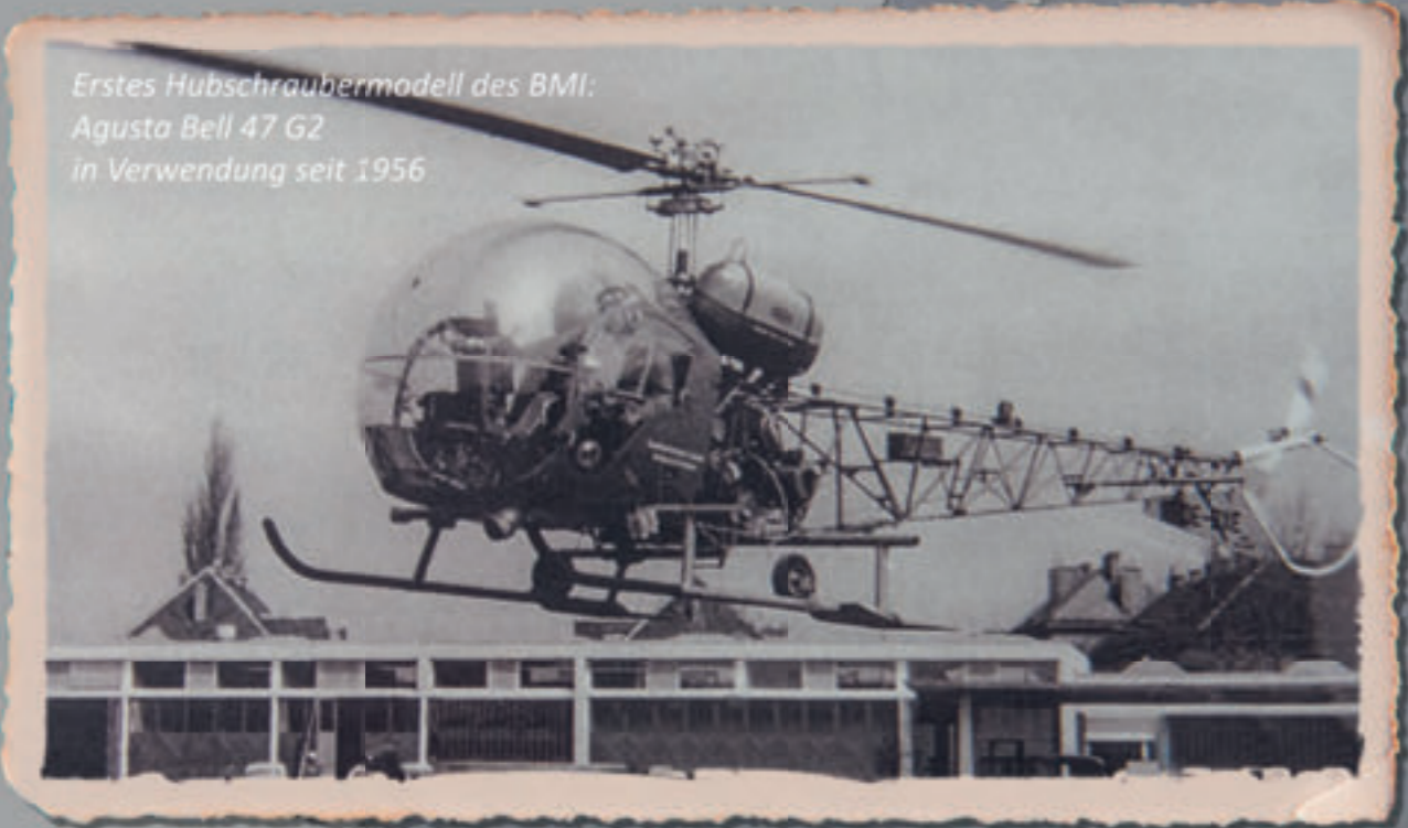
Erstes Hubschraubermodell des BMI: Agusta Bell 47 G2 in Verwendung seit 1956