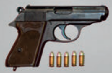
Pistole Walther PPK (steht für Polizeipistole Kriminal!), Kal. 7,65 mm, in Verwendung von 1968 bis 1995