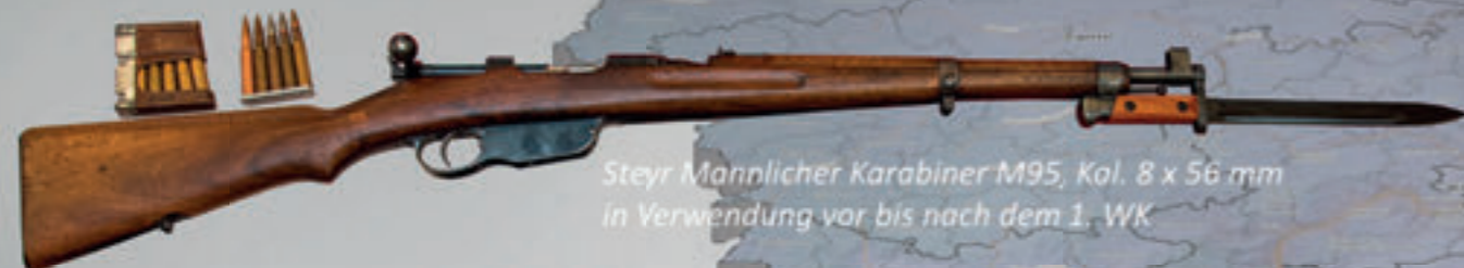
Steyr Männlicher Karabiner M95, Kal. 8 x 56 mm in Verwendung vor bis nach dem 1. WK