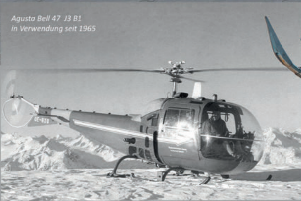
Agusta Bell 47 J3 B1 in Verwendung seit 1965