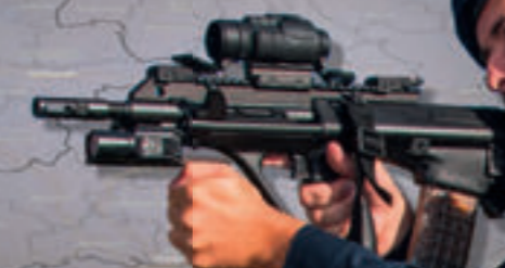
Sturmgewehr Steyr AUG A3, Kal. 5,56 x 45 mm NATO, in Verwendung seit 2020