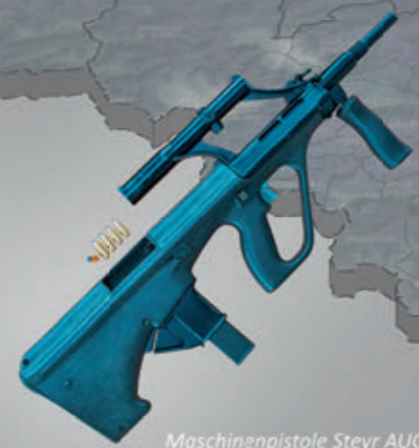
Maschinenpistole Steyr AUG 9 mm „MP 88“ in Verwendung seit 1989