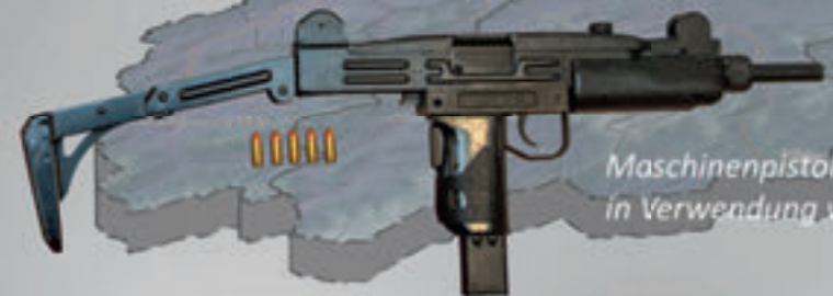
Maschinenpistole UZI, Kal. 9 mm in Verwendung von 1963 bis 1988