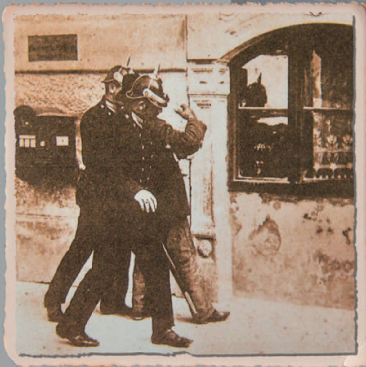
Adjustierung der Sicherheitswache um 1900