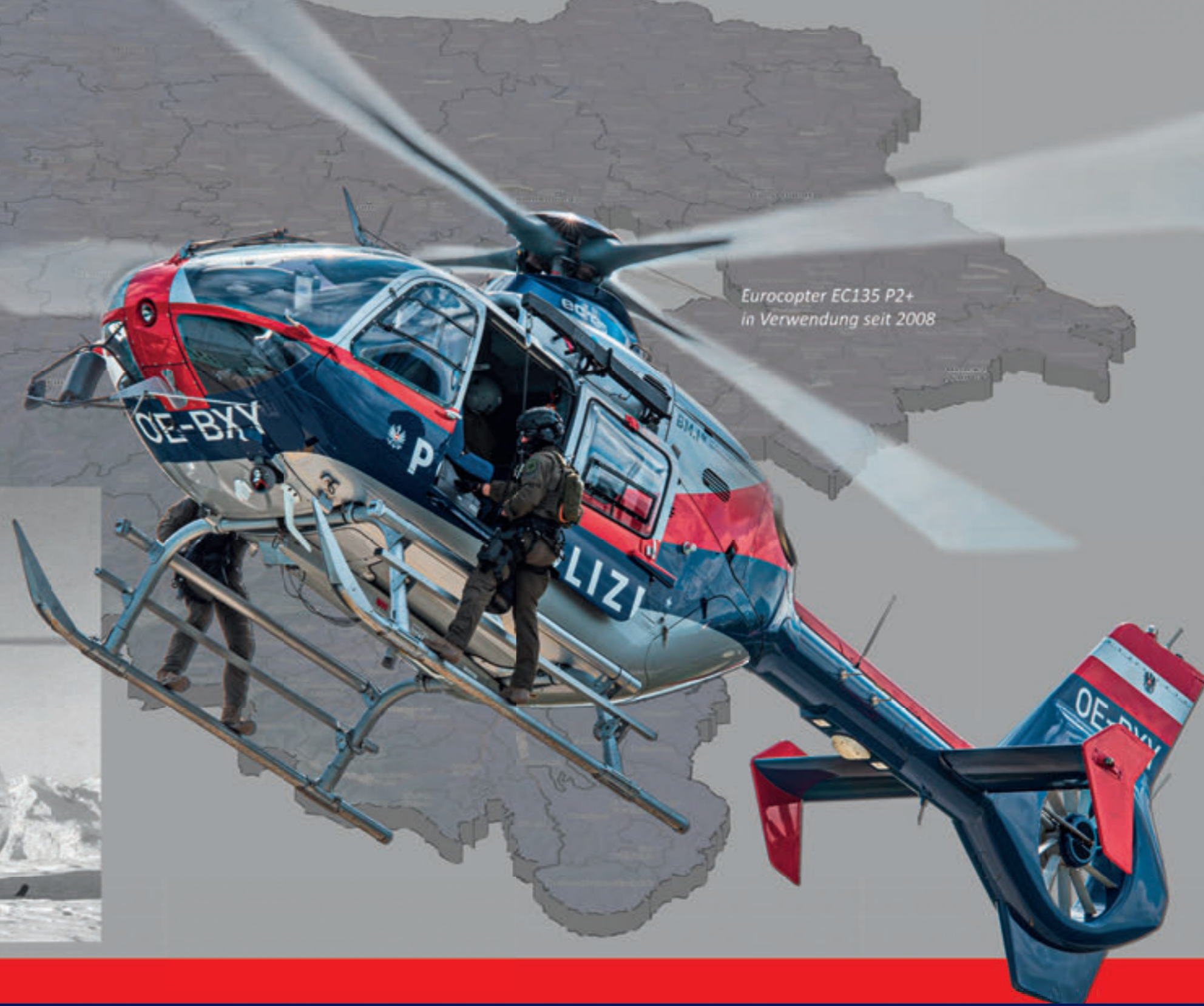
Eurocopter EC135 P2+ in Verwendung seit 2008