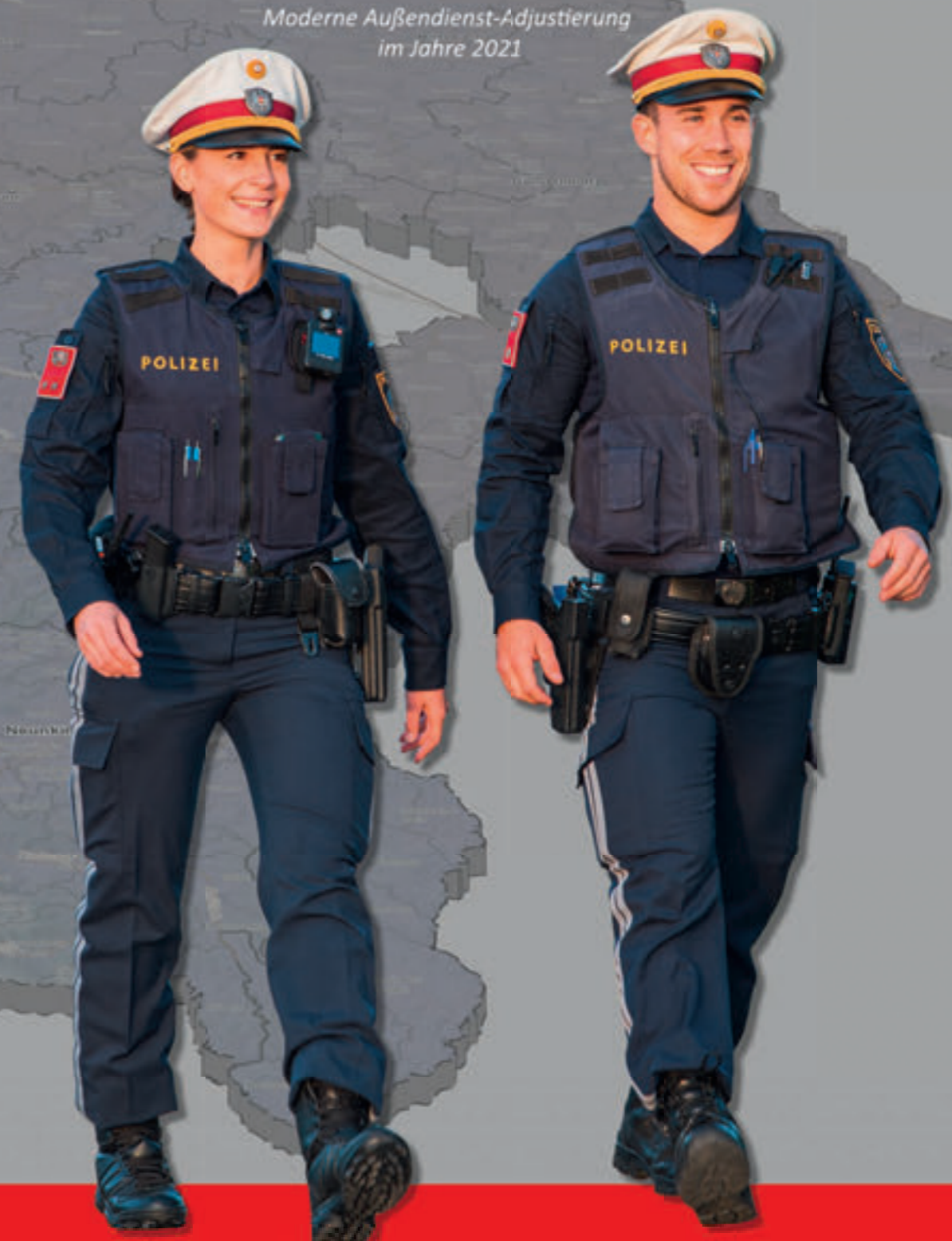
Moderne Außendienst-Adjustierung im Jahre 2021