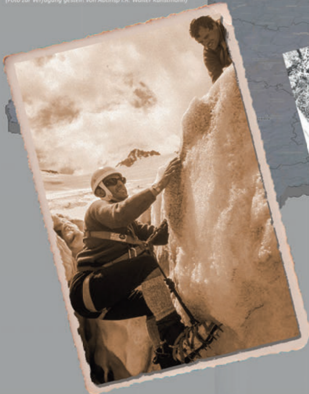
Alpinausbildung im Jahre 1982