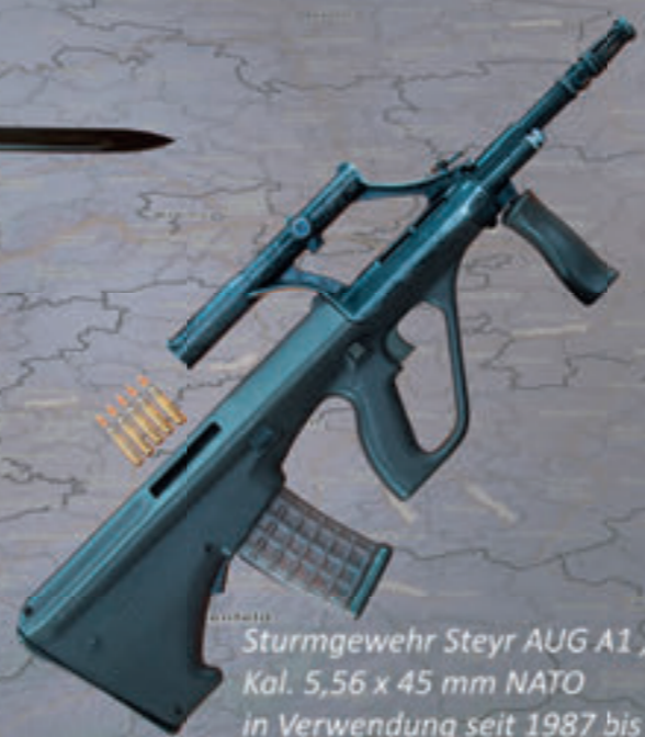
Sturmgewehr Steyr AUG A1 „StG 77“ Kal. 5,56 x 45 mm NATO in Verwendung seit 1987 bis 2020