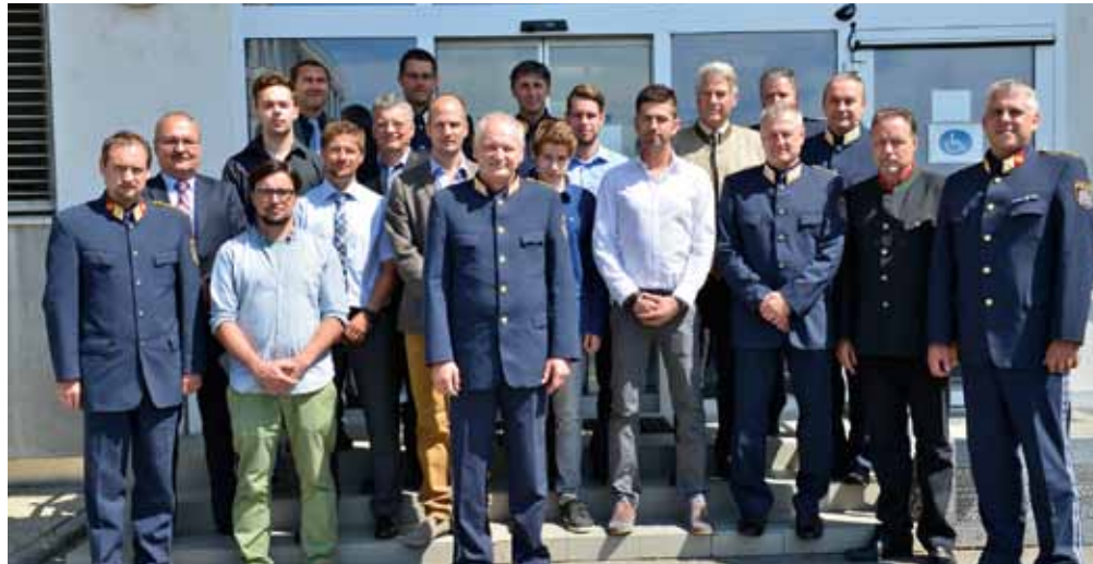
Polizeifunktionäre und die couragierten Helfer

Sie haben hingesehen, hingehört und haben gehandelt, ohne sich selbst zu gefährden. Zwölf Männer haben in sechs Fällen durch ihre Aufmerksamkeit und durch entschlossenes Handeln dazu beigetragen, dass fünf Menschen vor großem Schaden bewahrt und ein Serieneinbrecher gefasst wurden. In drei Fällen begaben sich die Helfer selbst in Gefahr, um einen Menschen vor dem sicheren Tod retten zu können. In einem weiteren Fall hat ein Taxilenker aufmerksam zugehört und damit eine Seniorin vor großem Schaden bewahrt. Dank eines aufmerksamen Studenten konnte ein gesuchter Vergewaltiger aus Wien festgenommen werden und drei Männer hielten am Neujahrstag einen Serienautoeinbrecher bis zum Eintreffen der Polizei fest. „Hinschauen statt wegsehen“ war das gemeinsame Motto dieser zwölf couragierten Männer. „Mut und Entschlossenheit der Zivilpersonen waren