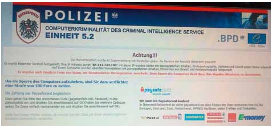
So oder so ähnlich kann dieser Polizeivirus ausschauen

Wie Sie sich und Ihren Computer vor dem berüchtigten Polizeivirus schützen können – und ihn im Bedarfsfall wieder loswerden.