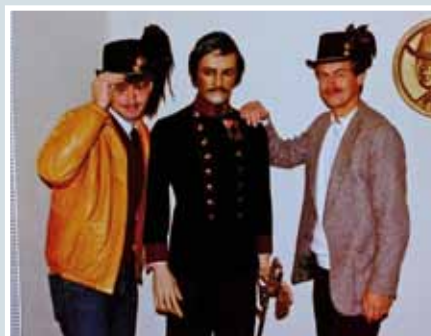
Mit Puppen und Hüten wurde gern gescherzt