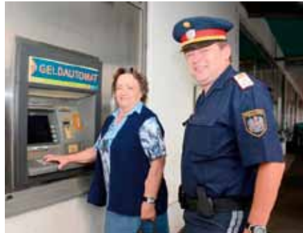
Tipps für den sicheren Umgang mit Bankautomaten gehören auch dazu

Z iel des Projektes „Sichere Gemeinde“, eine Kooperation zwischen Innenministerium und Gemeindebund, ist es, das subjektive Sicherheitsempfinden in der Bevölkerung deutlich anzuheben. Ein Eckpfeiler des Projektes ist der so genannte „Dorfpolizist“. Polizistinnen und Polizisten streifen zu Fuß durch Orte, suchen den direkten Kontakt zur Bevölkerung, stehen mit Rat und Tat zur Verfügung und vermitteln so ein Gefühl von Sicherheit. In Gemeinden ohne Polizeidienststelle