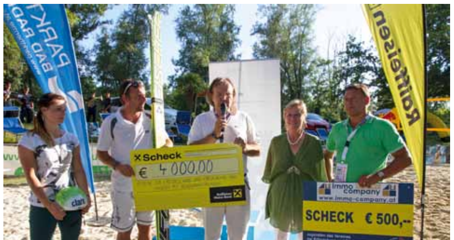
Bei der Scheckübergabe