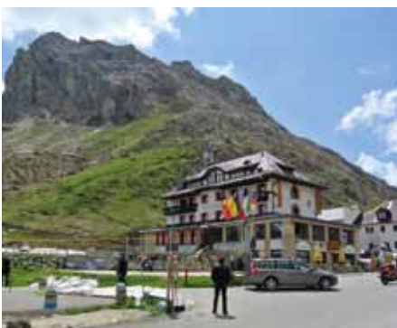
Rast an der Grenze