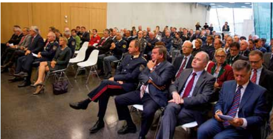
Reihenweise Prominenz bei der abendlichen Festveranstaltung