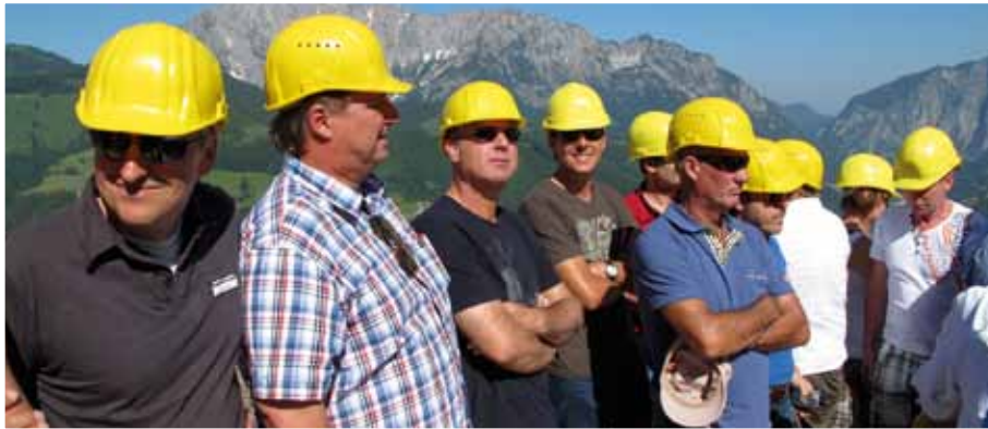
Gespanntes Warten auf die Gesteinssprengung