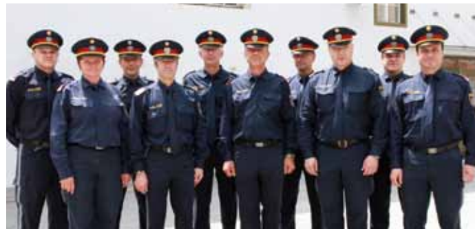
Die Belegschaft der Polizeiinspektion

Die gut besuchte Veranstaltung wurde in Kooperation mit der Feuerwehr, dem Roten Kreuz und der Landespolizeidirektion Steiermark durchgeführt. Das Rahmenprogramm umfasste einen Stationsbetrieb, bei dem Fahrzeuge sowie technische Hilfsmittel zur Schau gestellt wurden und Informationen rund um die Tätigkeiten der jeweiligen Organisation eingeholt werden konnten. Das durch das