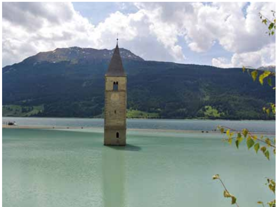
... der Turm im Reschensee

Beim Motorradbewerb ging es darum, eine BMW 1200 GS so schnell