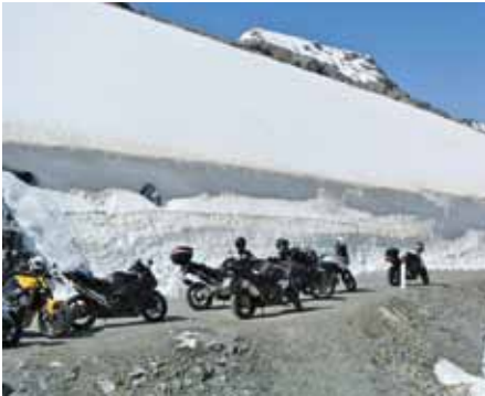
Nicht alltägliche Bilder bei der Anreise: Schneemassen, ...

Polizeimotorsportler aus ganz Europa trafen sich Anfang Juli zur 67. Internationalen Polizeisternfahrt in Südtirol. Neben dem Informationsaustausch unter Kollegen und der Sternfahrerparade bildete der dritte EM-Lauf dabei einen Höhepunkt. Und die Steirer, die fuhren ganz vorne mit.