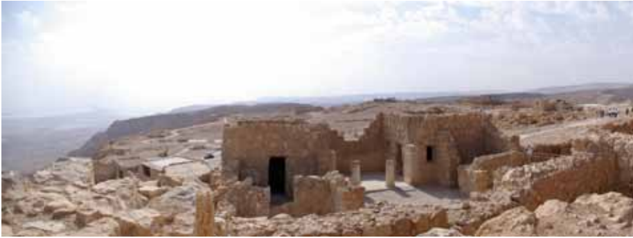
UNESCO-Weltkulturerbe: die Festung Massada

te Bet Sche'an im Jordantal, Nazareth (Besichtigung des Ortskerns und der Verkündigungskirche) und das biblische Kanaa. Übernachtung in einem Kibbuzgästehaus in Galiläa.