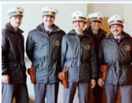
Fast schon einsatzbereit