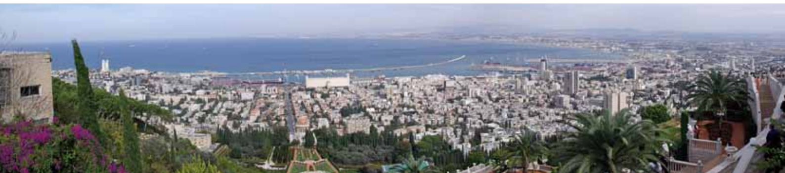
Blick auf Haifa

Donnerstag, 20. Februar: Fahrt in das Tal Wadi Qelt mit seinen antiken Aquädukten und dem St. Georgskloster. Weitere Stationen: Jericho (Maulbeerbaum des Zachäus, Qasr El Yehud – Taufstelle Jesu), die Ausgrabungsstät-