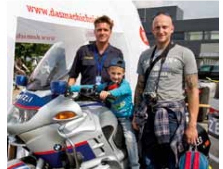
Polizei informiert im Ausstellungsbereich

Am 28. und 29. Juni besuchten 300.000 Zuseher die Flugshow „AIRPOWER 13“ in Zeltweg. Das verlangte natürlich auch der steirischen Polizei viel an Arbeit ab. An beiden Veranstaltungstagen waren zwischen 200 und 250 Polizeikräfte im Einsatz. Eine große Herausforderung war es, die 24 Großparkplätze mit etwa 25.000 Pkw, 380 Bussen, 1.200 Motorrädern und 1.200 Campingbussen zu füllen und auch das Abströmen der Besucher zu gewährleisten. Insgesamt lief die Veranstaltung reibungslos und geordnet ab. Es gab keine nennenswerten Vorfälle, die ein polizeiliches Einschreiten erforderlich gemacht hätten. Lt. Mag. Ursula Auer, Leiterin des Polizeieinsatzstabes: „Eine Veranstaltung dieser Di-