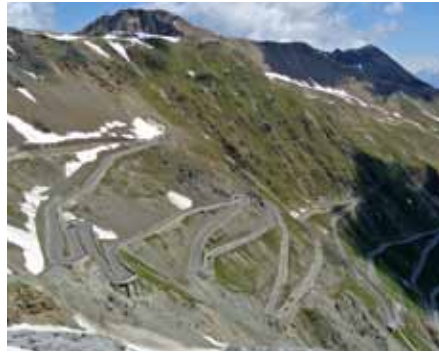
... knifflige Übungskilometer und ...

und fehlerfrei wie möglich durch einen anspruchsvollen Parcours zu manövrieren – enge Kurven, ein schneller Lastwechselslalom, eine Wippe und eine Reihe kniffliger Passagen waren zu meistern. Der Pkw-Bewerb war als Slalom angelegt. Hier galt es, einen VW Golf möglichst schnell durch zahlreiche Tore zu bewegen.