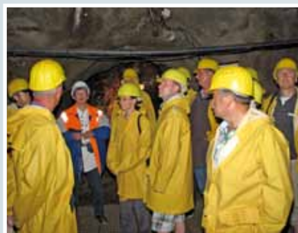
Führung unter Tag...