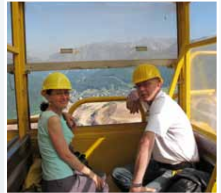
Schöne Aussichten bei der Hauly-Fahrt