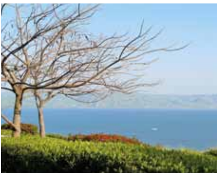
Am See Genesareth

Der Pauschalpreis für diese Rundreise beträgt 1.440 Euro pro Person (Einzelzimmerzuschlag 330 Euro). Inkludierte Leistungen: Bustransfer Graz – Flughafen Wien – Graz, Flug Wien – Tel Aviv