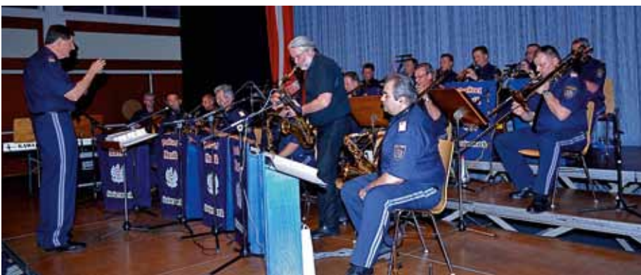
Die Big Band der Polizeimusik Steiermark.

Rund 200 Gäste waren zum Benefizkonzert in die Kultur- und Sporthalle Sinabelkirchen gekommen