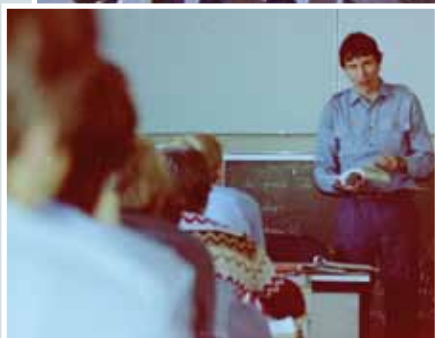
Wenn alles wacht und einer spricht...