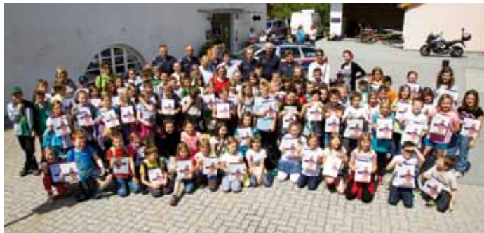
Zahlreiche jugendliche Besucher

Mit einem „Tag der offenen Tür“ feierte die Polizeiinspektion Voralpe am 7. Juni 2013 den Bezug ihrer neuen Polizeidienststelle.