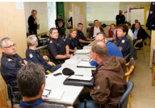
Besprechung im Polizei-Einsatzstab