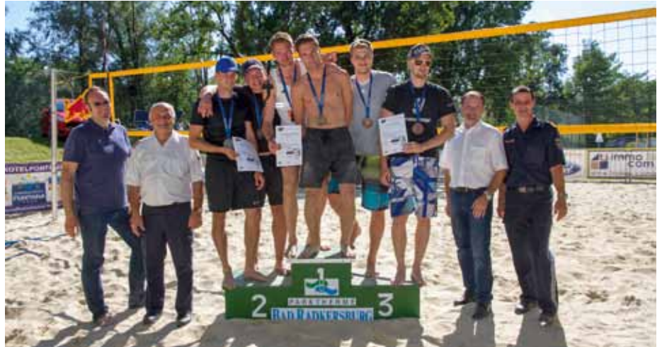
Platz 1 bis 3 der Landesmeisterschaft mit Ehrengästen