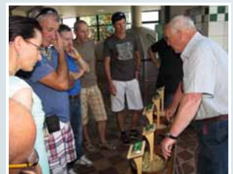
... und im Brauereimuseum