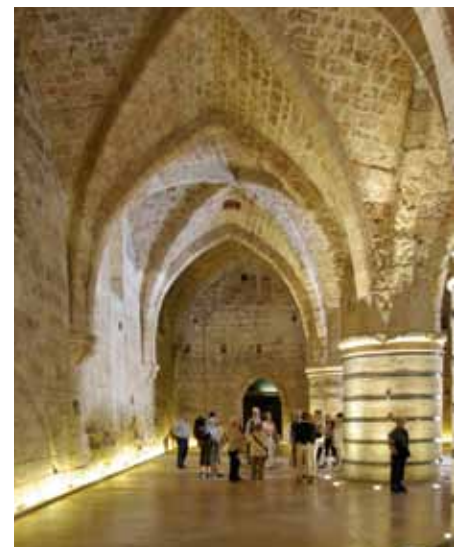
In der Kreuzritterfestung in Akko