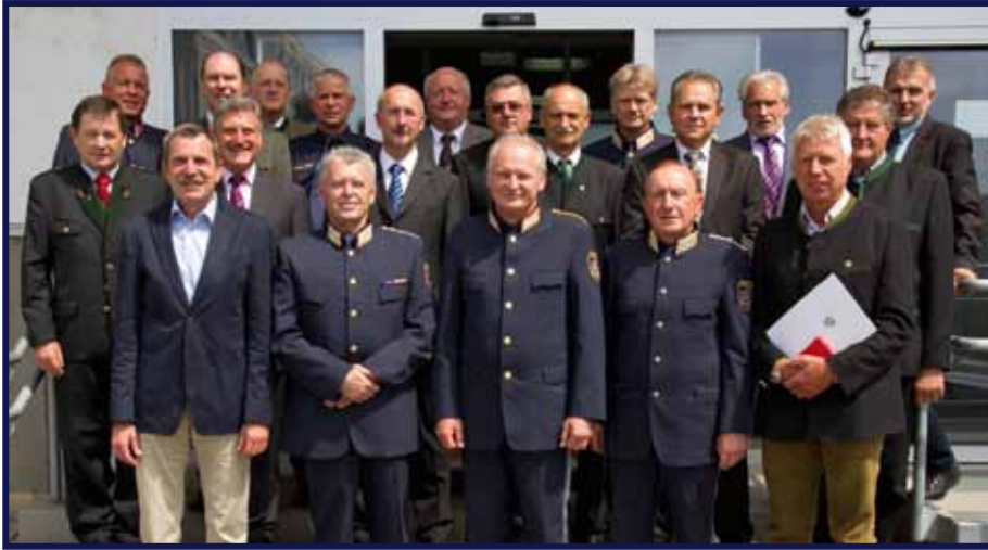
Gruppenfoto der Ehrung vom 14. Juni