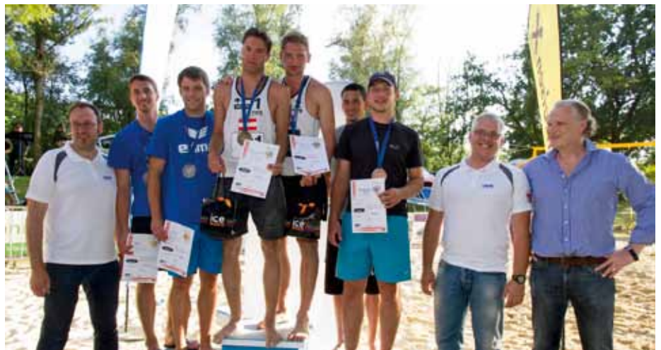
Platz 1 bis 3 der Bundesmeisterschaft mit Ehrengästen