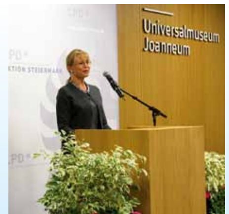
Beatrix Karl überbrachte Dankesworte von Innenministerin Johanna Mikl-Leitner