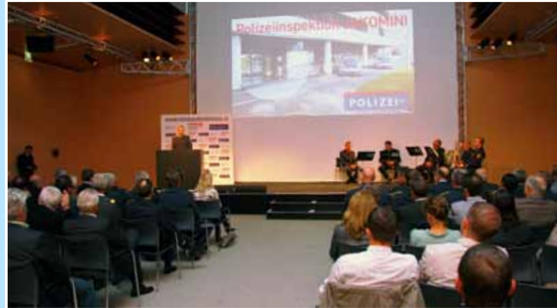
Festakt zur Inspektionseröffnung im Messecenter Graz