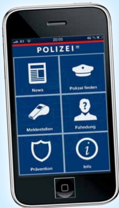
Kostenlos in App-Stores: die Polizei-App