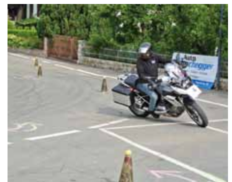
Teil des Motorradparcours