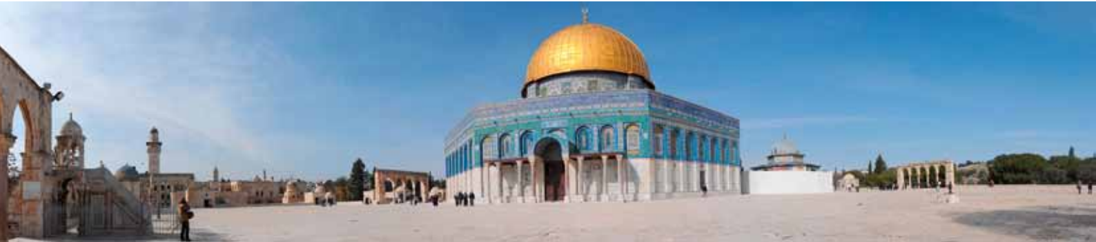
Panorama vom Tempelberg mit dem berühmten Felsendom