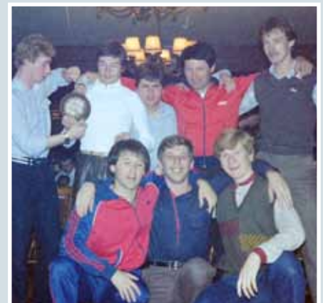
Gute Laune beim Schikurs