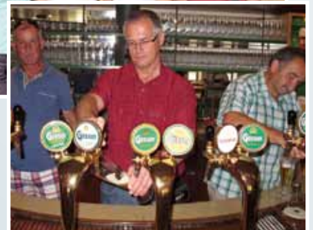
Für jeden ein Glas in Ehren