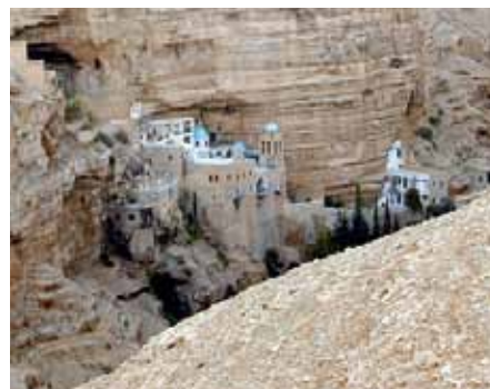
Das St. Georgskloster