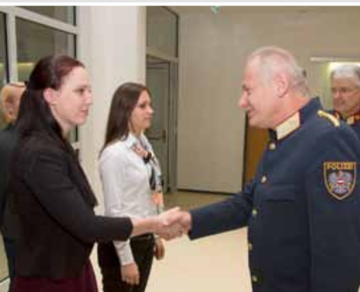
Jeder bzw. jede Auszubildende wurde per Handschlag angelobt.

Die Grundausbildung bei der Polizei dauert 24 Monate und gliedert sich in zwei Abschnitte, die jeweils eine Praxisphase beinhalten. Zusätzlich zu diesen Praktika haben die Auszubildenden rund 2700 Unterrichtseinheiten in den Bereichen Recht, Kriminalistik, Technik und Taktik sowie Bürokommunikation und Persönlichkeitsbildung zu absolvieren. Sowohl inhaltlich als auch methodisch zielt die Ausbildung nicht nur auf Sachwissen, sondern verstärkt auf Methoden- und Handlungswissen ab. Hohe menschliche Kompetenz soll Ziel der Ausbildung sein. Die Werte, die den Auszubildenden vermittelt werden, wurden im Leitbild „Sicher mit Bildung“ zu Papier gebracht.