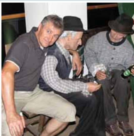
Posieren wie damals