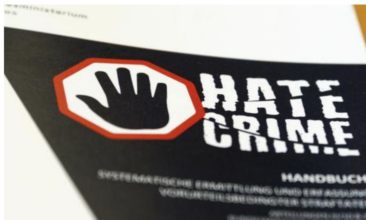
Im Projekt erarbeitet: Systematische Prüfung von gesetzten Delikten auf die Motivlage Vorurteils-kriminalität hin.

ERNST. Nun geht es darum, die im Projekt erarbeiteten und bei der Schulung vermittelten Inhalte in der täglichen Polizeiarbeit in die Praxis umzusetzen. Um die Beurteilung zu erleichtern, ob es sich bei einer Straftat um Hate-Crime handelt, wurden die Vorurteilsindikatoren in den Merksatz verpackt „Hate-Crime ist ERNST und wir nehmen es ERNST!“. Das Akronym „ERNST“ setzt sich aus Anfangsbuchstaben zusammen. und zwar „Empfin-