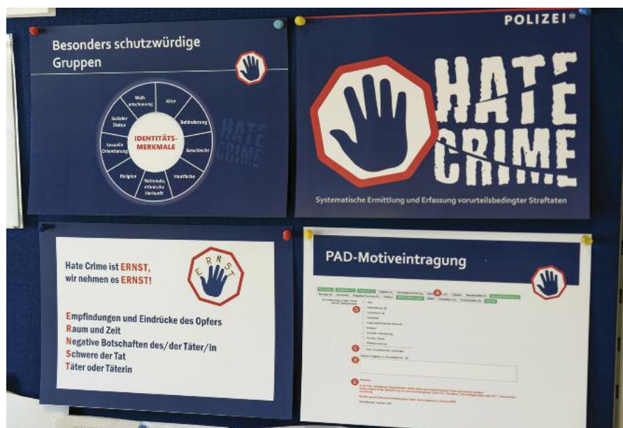
„ERNST“: „Empfindungen und Eindrücke“, „Raum und Zeit“, „negative Botschaften der Täterin bzw. des Täters“, „Schwere der Tat“, „Täterin bzw. Täter“.

Message-Crime. Bei vorurteilsmotivierten Straftaten ist nicht nur das Opfer, sondern auch die Gruppe betroffen, zu der es gehört. „Man spricht von „Message-Crime“. „Durch die Tat wird eine Botschaft der Ablehnung an die