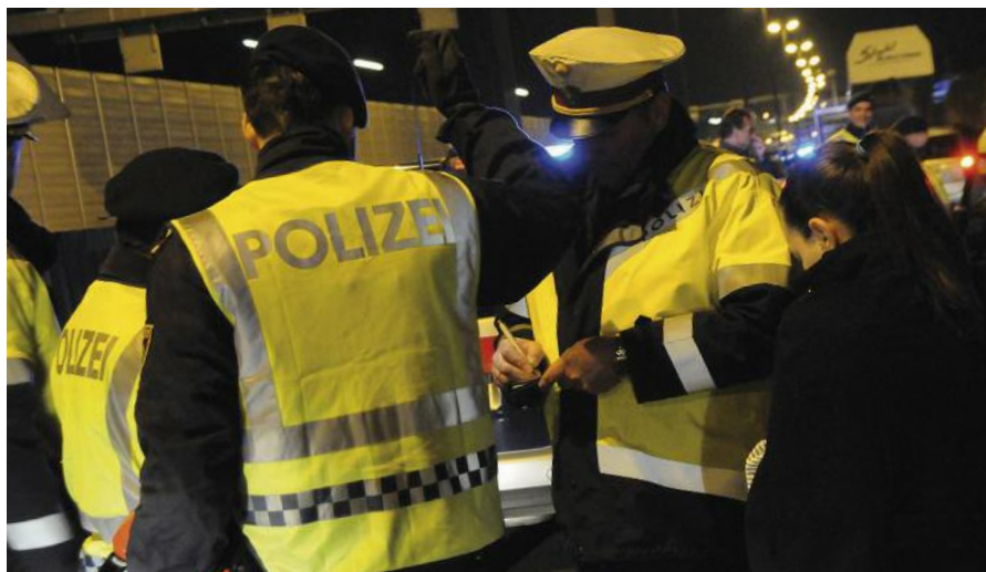
Landesverkehrsabteilung: Nachtaktion gegen Raser