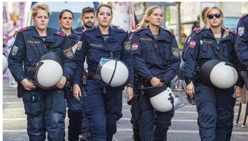
Frauen bei der Polizei 2021: Polizistinnen erfüllen genau dieselben Aufgaben wie ihre männlichen Kollegen im Außen- und im Innendienst.

Nur wenige blieben bis zum Pensionsantritt im Dienst