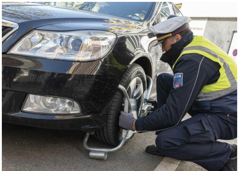
Die Mitarbeiter der PÜG bringen mitunter Radklammern zur Sicherung der Strafverfolgung an widerrechtlich abgestellten Fahrzeugen an.

„Die Kontrolle der Kurzparkzonen stellt nur einen Teilbereich der Aufgaben der PÜG dar“, erklärt Kreuzer. Die Kontrollorgane sind ebenso für die Überwachung des gesamten ruhenden Verkehrs auf öffentlichen Straßen in Wien verantwortlich – sprich für Fahrzeuge, die abgestellt bzw. geparkt wurden. „Wie die Polizistinnen und Polizisten, ahnden meine Mitarbeiter das Halten in zweiter Spur, am Gehsteig, auf einem Behindertenparkplatz oder in einer Haus- und Grundstückseinfahrt“, sagt Kreuzer. „Damit der übrige Verkehr fließen kann, muss der ruhende Verkehr unter Kontrolle gehalten werden. Falsch abgestellte Fahrzeuge können in einer Metropole wie Wien eine Kettenreaktion auslösen und schwere Verkehrsunfälle verursachen.“