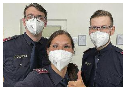
Neue dienstführende Polizistinnen und Polizisten für Wien und OÖ.

Trotz Pandemie schlossen Polizistinnen und Polizisten aus Wien und Oberösterreich die Grundausbildung zur/zum dienstführenden Exekutivbediensteten (GAL/E2a) ab. Als Führungskräfte werden die Absolventinnen und Absolventen künftig in einer Polizeiinspektion, in der Lan-