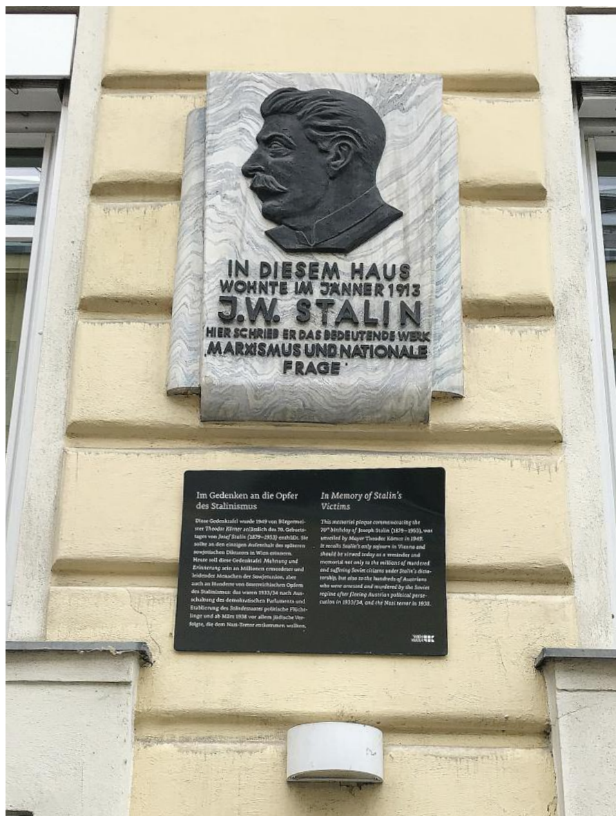
Die Gedenktafel in Wien ist heute das vermutlich einzig verbliebene Stalin-Denkmal in Westeuropa, allerdings mit einem Zusatz, durch den zumindest der blutrünstige Diktator nicht verherrlicht wird.

Erklärende Zusatztafel. Der Text auf der Gedenktafel verherrlicht zumindest den blutrünstigen Diktator Stalin nicht. Im Jahr 2012 wurde eine Zusatztafel angebracht – mit folgen-