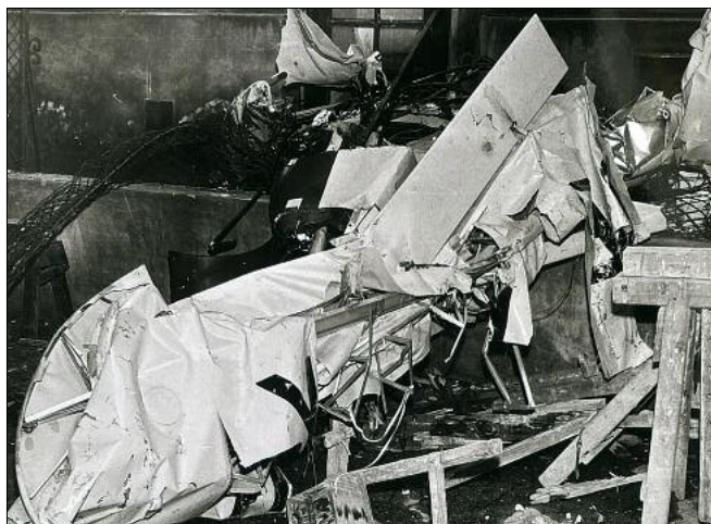
Eines der abgestürzten Flugzeuge in Wien-Neubau.