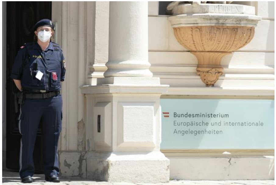
Objektschutz im Regierungsviertel: Durch Zuteilungen und Freiwilligenmeldungen verjüngt sich die Mannschaft kontinuierlich.

Bedrohungslagen. Der Bedarf hängt von der jeweiligen politischen Situation ab, wobei neben der Bedrohungslage Faktoren eine Rolle spielen, wie die Anzahl der Staatsbesuche. Zusätzlich zum Objektschutz im Regierungsviertel ist die ASE 3 für den dis-