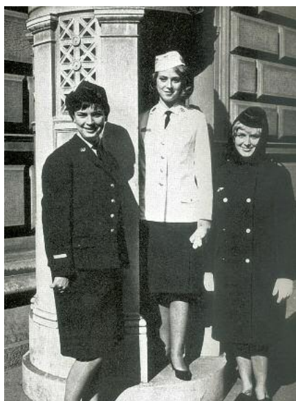
Pilotprojekt „Frauen zur Polizei“ 1965 gegen Personalmangel bei der Polizei.

Öffentlichkeitsrecht. Nachdem das Städtische Jugendamt in Wien einen Großteil der Fürsorgeaufgaben übernommen hatte, wurden die Polizeifürsorgerinnen vermehrt mit verwaltungs- und kriminalpolizeilichen Tätigkeiten betraut.