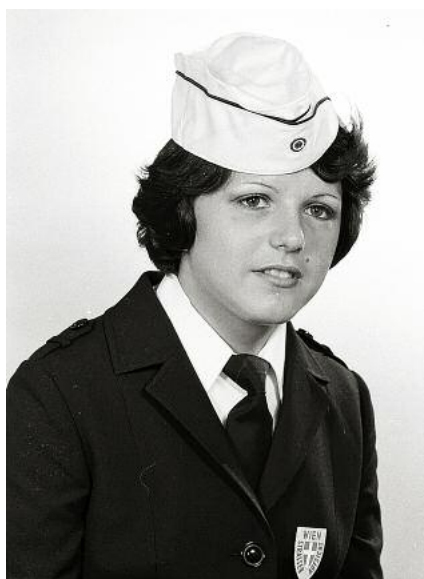
Ab 1971: Politessen überwachen den ruhenden Verkehr in Wien.