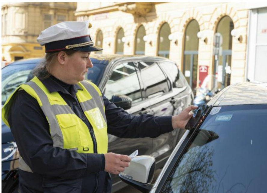
Wenn jemand einen Parkschein über eine App bucht, muss das Kennzeichen des Fahrzeuges in einer Datenbank abgefragt werden.

Verärgerte Falschparker. Im April 2020 ist ein PÜG-Mitarbeiter wiederholt auf denselben Parksünder gestoßen. Der 33-Jährige ist zuerst beanstandet worden, da er verbotenerweise in einer Ladezone seinen Pkw geparkt hatte. Das Kontrollorgan wurde bei der Beanstandung von dem Lenker ange-