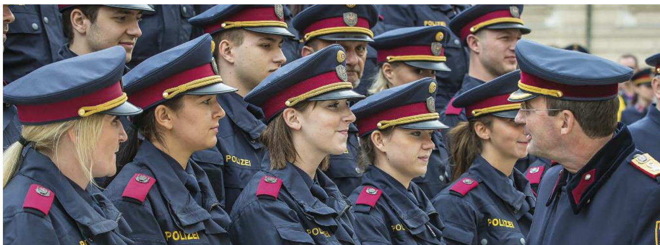
Ausmusterungen bei der Polizei 2021: Der Frauenanteil in den Polizeischulklassen ist hoch.

Da die Arbeit der Jugendpolizei hauptsächlich kriminalpolizeilichen Charakter hatte, wurden 28 Polizeifürsorgerinnen mit 1. Jänner 1951 in den Kriminaldienst übergeleitet. Sie erhielten die Bezeichnung „weibliche Kriminalbeamte“, absolvierten den Kriminalbeamtenkurs und erhielten das gleiche Gehalt wie ihre männlichen Kollegen. Ihre Aufgaben bestanden in Amtshandlungen im Zusammenhang mit Kindern sowie Mädchen unter 18 Jahren, in kriminalpolizeilichen Amts-